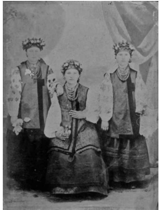
Візитна фотографія із зображенням трьох дівчат, зроблена на початку ХХ століття в салоні «І. Л. Бендицький і син»

Також відомо, що в дитячі роки він товаришував з сусідським хлопчиком Соломоном Рабиновичем, у майбутньому – відомим єврейським письменником Шолом-Алейхемом.