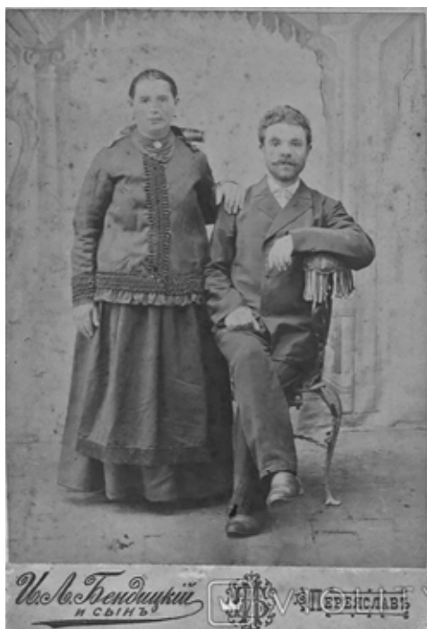
Фотографія сімейного подружжя, зроблена на початку ХХ століття в салоні «І. Л. Бендицький і син»

Процес виготовлення фотографій був доволі трудомістким. Отриману після проявлення та закріплення світлину майстер обов'язково ретушував (підправляв дрібні недоліки), домальовував ефекти (за бажанням замовника). Під фото майстер ставив своє факсиміле (відтворений за допомогою копіювання оригінальний власноручний підпис особи). Готовий знімок наклеювали на основу (картон-паспарту), яка друкувалася окремо, у друкарні, зверху все накривали пергаментним папером. Часто світлину обводили фігурною рамкою золотистого, сріблястого чи іншого кольору, виконану тисненням. На звороті фотокартки розміщували вихідні дані: інформацію про майстра, адресу ательє, отримані нагороди (зображення медалей учасника міжнародних виставок), відомості про знаних осіб, які фотографувалися в салоні, власну рекламу. Обов'язково на світлинні фотограф ставив особистий штамп. Адже будь-яка друкowana продукція у російській імперії підпадала під