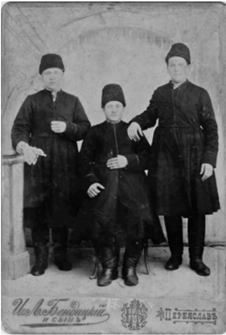
Фотографія трьох парубків, зроблена на початку ХХ століття в салоні «І. Л. Бендицький і син»

наукового дослідження величезні, а в сукупності з іншими джерелами інформації (усними і письмовими свідченнями) – взагалі неоціненні. Досліджуючи світлини, можна отримати інформацію про різноманітні аспекти людського буття (повсякдення, побут, мода, рідинне життя, виробничі процеси, розваги, дозвілля), дізнатися про історичні події, звичаї, культурне та політичне життя суспільства відповідного історичного періоду. У зв'язку з цим фотографії як багатогранний образ минулого становлять інтерес для дослідників різного профілю (істориків, етнографів, мистецтвознавців, соціологів, антропологів, культурологів), що зумовлює їх міждисциплінарний характер як джерела інформації.