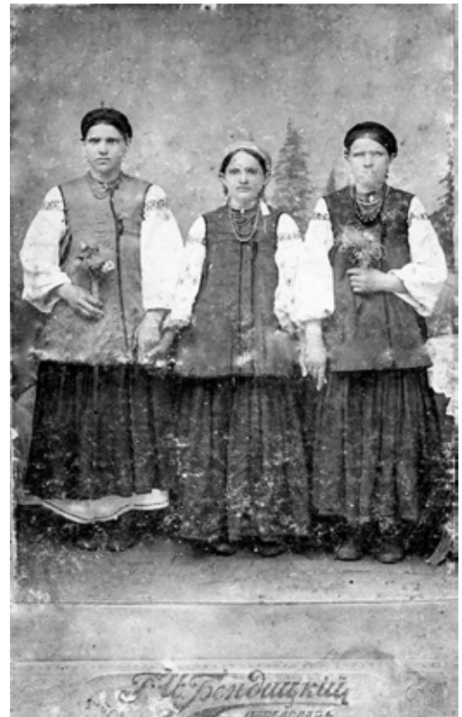
Жіночий гуртовий портрет, зроблений на початку XX століття в салоні «І. Л. Бендицький і син»

Переяславка В. Левченко у 2000 році подарувала музею два кабінетних фото розміром 11x16 см, зроблені на початку XX століття в салоні «І. Л. Бендицький і син». На першій світлині (інв. № Ф-1513) зображено троє парубків у вишитих сорочках, темних свитах, шкіряних чоботях і смушевих шапках. Один із чоловіків – родич Євдокії Левченко, уродженки с. Підварки Переяславського повіту. Знімок зроблено на фоні «задника» у формі арки. У центрі чоловік сидить на стільці, двоє інших стоять по боках від нього. Під зображенням напис: «И. Л. Бендицький и сынъ. Переяславъ» та фірмовий