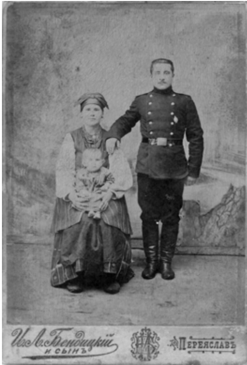
Візитна фотографія подружжя з маленькою дитиною, зроблена на початку XX століття в салоні «І. Л. Бендицький і син»

поняття «друкарської продукції», яка контролювалася відділом цензури Міністерства внутрішніх справ згідно із «Тимчасовими правилами про цензуру і друк» від 6 квітня 1865 р. Усі фотосалони перебували на обліку, обов'язково мали ліцензію, здавали щорічні звіти про прибутки.