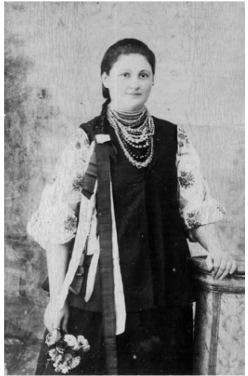
Фотографія дівчини, зроблена на початку ХХ століття в салоні «І. Л. Бендицький і син»

На зворотному боці фотобланків зображені фігурні написи в різній комбінації великих і малих літер, обрамлені