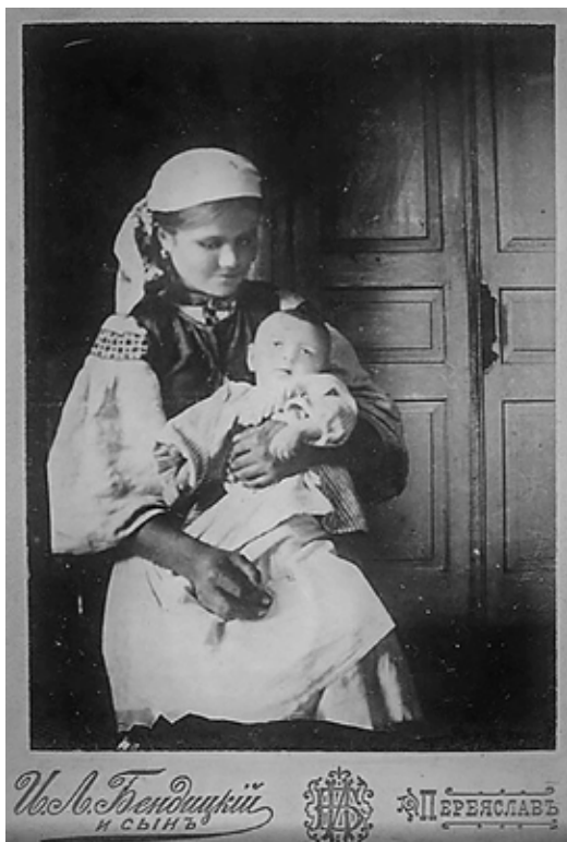
Фотографія молодої мами з дитиною, зроблена на початку XX століття в салоні «І. Л. Бендицький і син»

На окрему увагу заслуговують фотобланки салону Бендицьких. Це багатощарова конструкція із цупкого паперу або картону, на яку фотографі наклеювали світлинку. В другій половині XIX – на початку XX ст. їх називали «фотографічні бланки» або «бланки для наклеювання фотографічних знімків». Часом фотобланки плутають із паспарту – шматок картону прямокутної форми з вирізаним у ньому отвором під рамку, в яку вставляли світлинку, малюнок, гравюру тощо. Вперше фотографічні бланки з'явилися в 1849 р. й відразу стали предметом першої необхідності для фотографів. Вони були своєрідною візитівкою фотоательє. У кожного салону вони були різні, але мали