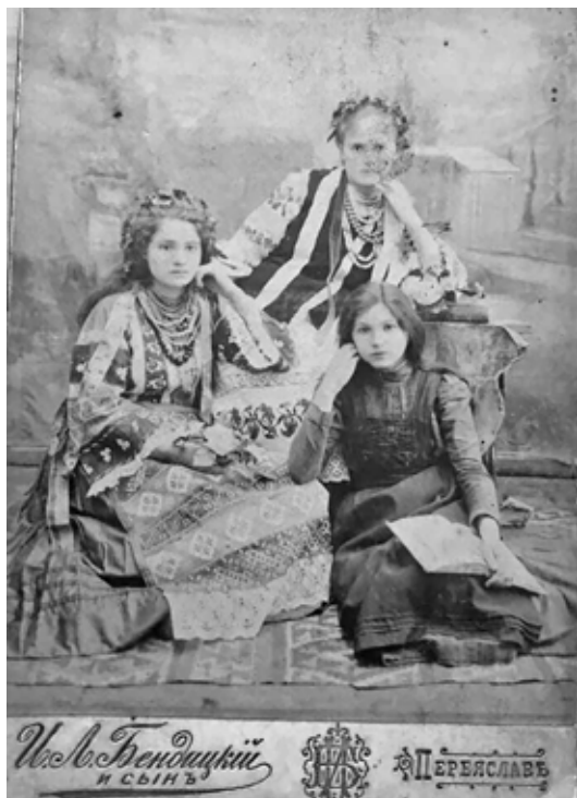
Фотографія трьох дівчат, зроблена на початку ХХ століття в салоні «І. Л. Бендицький і син»

Мета дослідження – проведення системного аналізу створення, становлення й функціонування фотосалону єврейської родини Бендицьких в українському мультикультурному місті Переяславі як важливого чинника етнокультурних процесів в Україні. Завдання дослідження: 1) охарактеризувати історіографію вивчення проблеми й джерельну базу; 2) розкрити особливості фотографії як самостійного об'єкта наукового дослідження; 3) проаналізувати історію фотоательє Бендицьких; 4) розкрити інформаційний, історичний, мистецький та