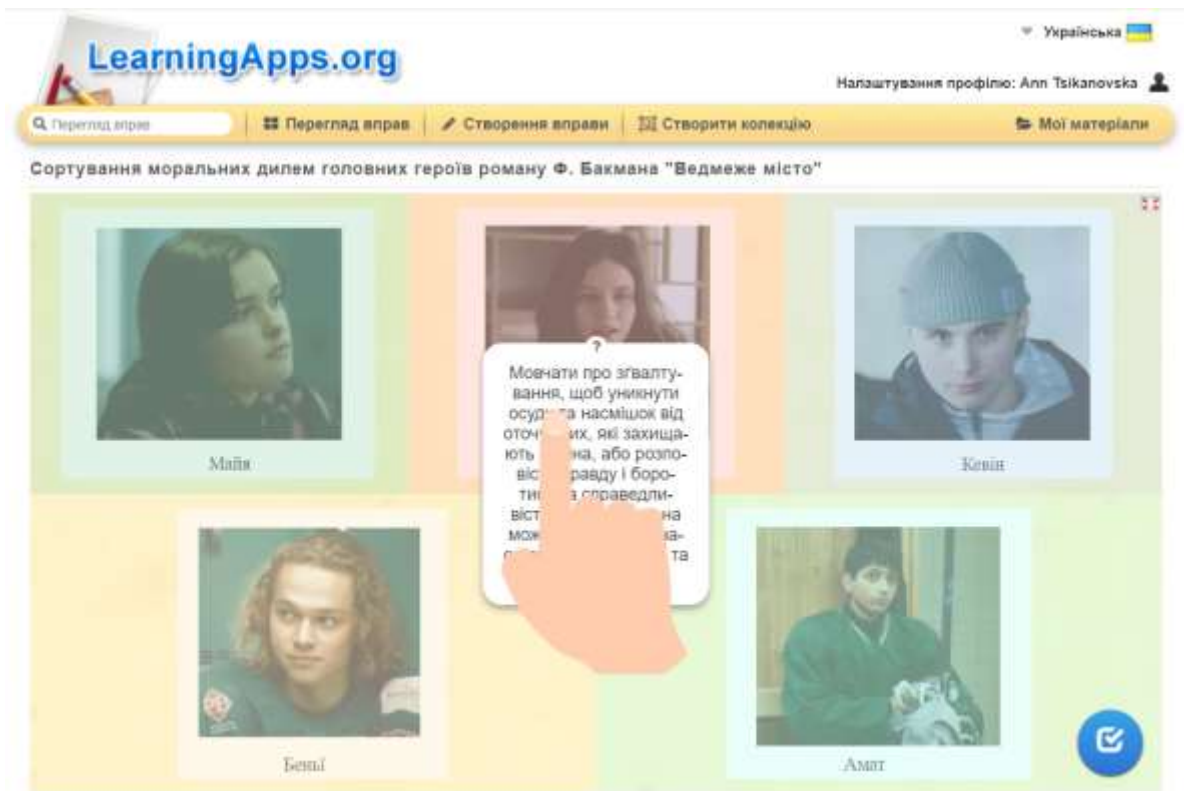
Рис. А.4. Моральні дилеми головних героїв роману Ф. Бакмана «Ведмеже місто»

Група 1. Кевін – талановитий і дисциплінований юнак, який присвячує більшу частину свого життя хокею. Має фізичну силу і витривалість, регулярно тренується, починаючи з ранку, коли ще темно, і продовжує до пізньої ночі, що формує його сильне тіло. У сім років Кевін так сильно обморозив обличчя, що на його вилицях залишилися невеликі білі плями. Це сталося після того, як він годинами тренувався на озері в умовах сильного холоду, намагаючись удосконалити свій удар ключкою. Кевін має виразні темні очі, його погляд зосереджений і проникливий. Кевін часто знаходиться в центрі уваги однолітків, завдяки своїм лідерським якостям та спортивним досягненням. Він має впевненість у собі, що відображається у його поведінці. Ці деталі складають образ Кевіна як молодого спортсмена з великою силою волі, який готовий пожертвувати всім заради успіху в хокеї.