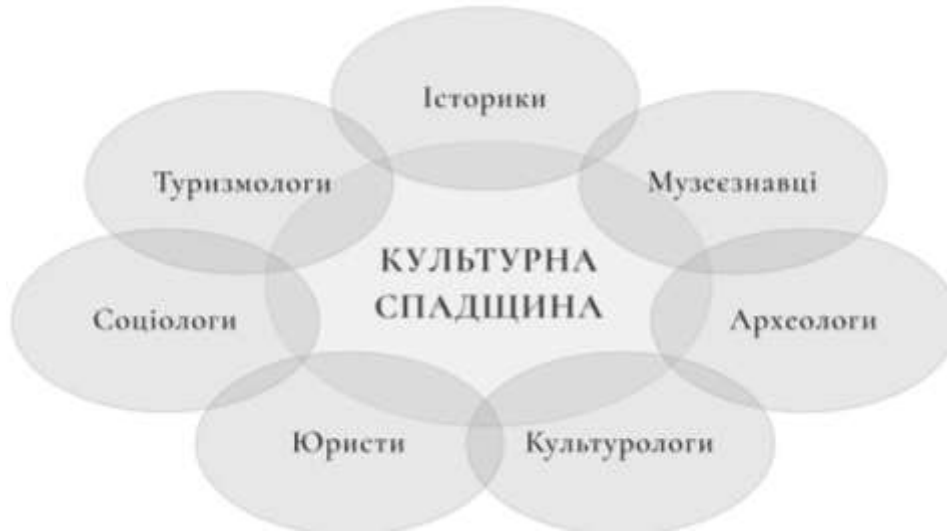
Рис.2. Схема поля взаємодії та взаємовпливу дослідників культурної спадщини (ATLAS Cultural Tourism Bibliography, 2021; Горбик, Денисенко, 2012)

Культурна спадщина стала предметом мультидисциплінарних досліджень (рис.2).