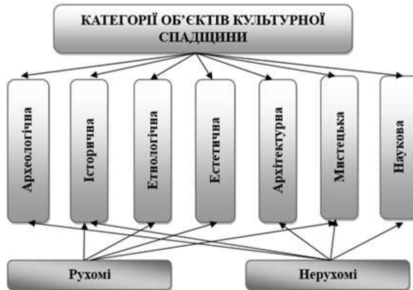
Рис. 1. Ціннісні категорії об'єктів культурної спадщини

До культурної спадщини (КС) відносяться духовні та інтелектуальні надбання: музичні та літературні твори, культурні цінності, освіта та наука, які є відображенням ступеню розвитку нації та НКС ( ATLAS Bibliography, 2021 ). КС охоплює різноманітні об'єкти, які мають цінність у кількох категоріях, таких як археологічна, історична, етнологічна, естетична, архітектурна, мистецька та наукова. Вона включає нерухомі (пам'ятники архітектури, археологічні розкопки) та рухомі об'єкти (художні колекції, культурні артефакти). (рис.1).