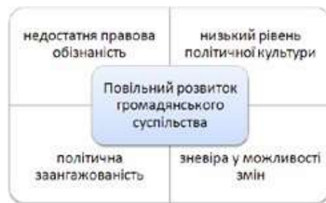
Рис. 3. Причини повільного розвитку громадянського суспільства в Україні

Загалом різноманітність інститутів громадянського суспільства в Україні за останні роки є дуже великою, і, природно, вони мають представляти інтереси значної кількості населення.