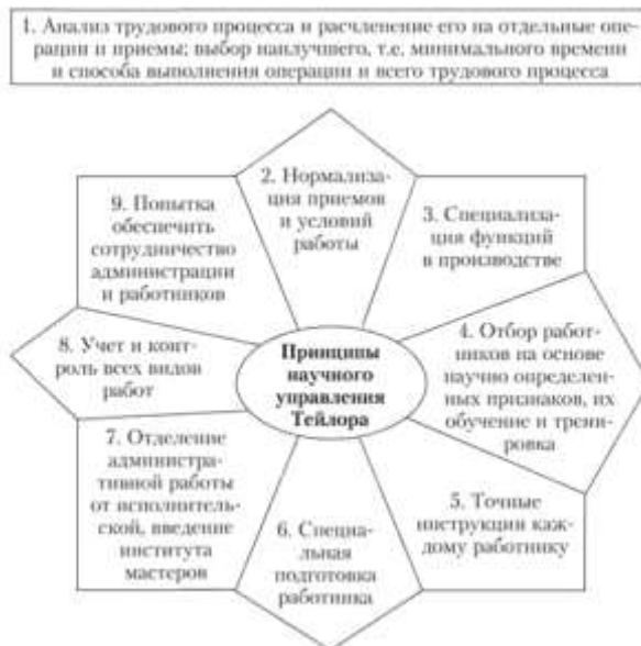
Рис. 1.4. Принципи наукового управління Тейлора

управління. Прихильники даної школи прагнули довести, що управляти можна "науково", спираючись на економічний, технічний і соціальний експеримент, а також на науковий аналіз явищ і фактів управлінського процесу і їх узагальнення. Цей метод вперше був застосований до окремо взятому підприємству американським інженером Фредерік Тейлор (1856-1915), якого і вважають основоположником наукового управління виробництвом. Тейлор розробив принципи наукового управління (рис. 1.4). Метою Тейлора було створення системи наукової організації праці (НОТ), що базується на основі експериментальних даних і аналізі процесів фізичної праці і сто організації.