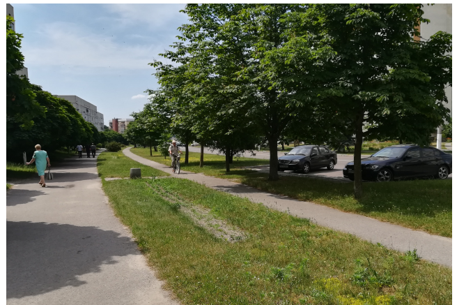
Рис. 1. Фото міста Славутич