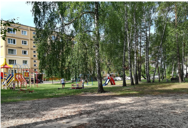
в) Внутрішній двір у Талліннському кварталі