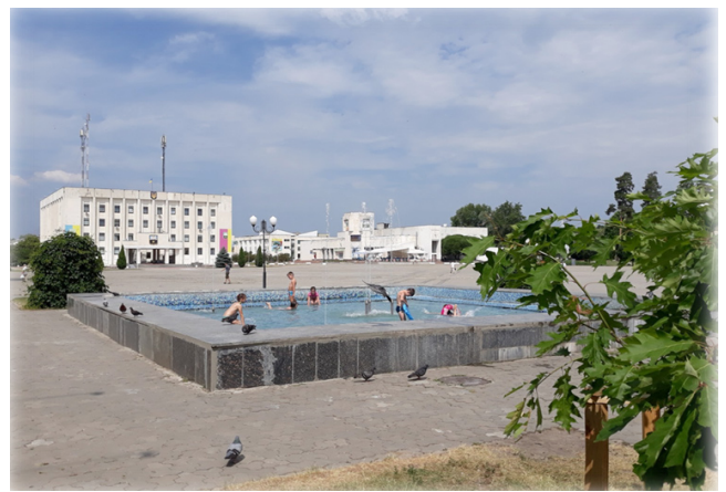
б) Центральна площа міста