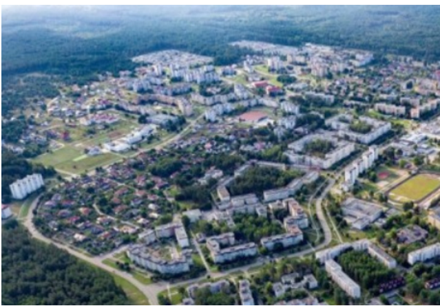
а) Панорама міста