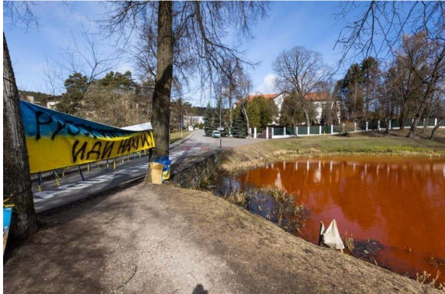
Рис. 2.4. Фото з перформансу у Вільнюсі