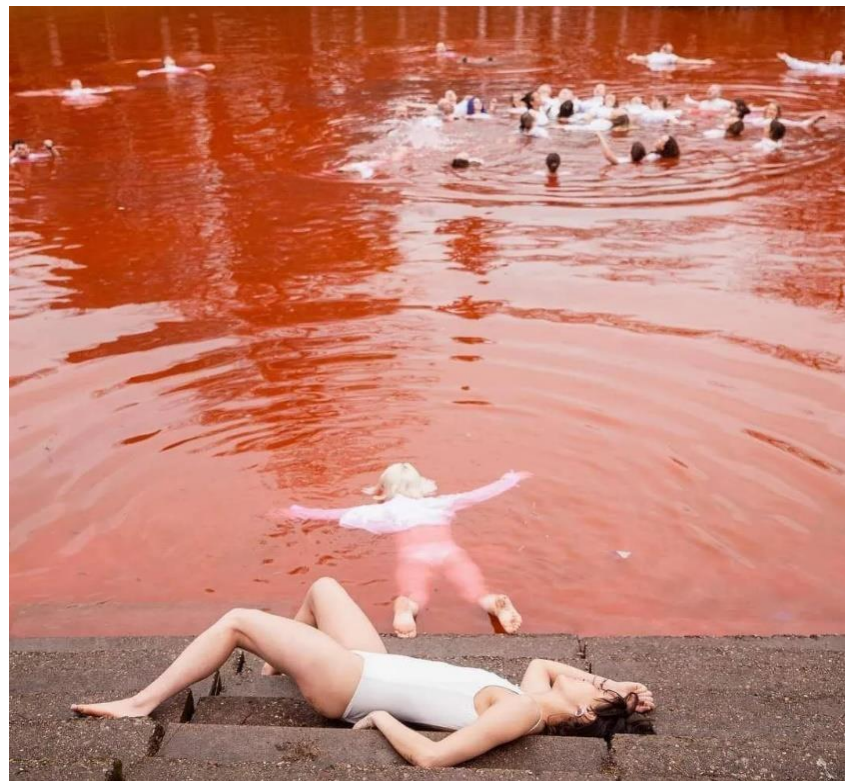
Рис. 2.5. Фото з перформансу у Вільнюсі

4. Акції у багатьох європейських містах на яких люди лягали на землю, аби привернути увагу до кількості невинних загиблих людей в Україні.