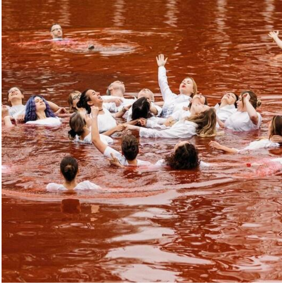
Рис. 3.6. Фото з перформансу у Вільнюсі

Проте однією з найбільш масових все ще залишають серія акцій, які були проведені у великих європейських містах, під час якої люди посеред площ просто лягали на землю. Це мало сказати політикам скільки насправді мирних невинних людей помирає через бездіяльність влади. Також це було спрямовано на звичайних громадян, котрі лягаючи з нашими співгромадянами могли відчути себе мертвими, через відчуття коли ти лежиш на холодній землі і знаєш що все вже вирішено. Довгостроково це може мати позитивний вплив не тільки на особисте ставлення до українців, але і на кількість гуманітарної допомоги та на те, який тиск у подальшому будуть здійснювати європейці на свою владу.