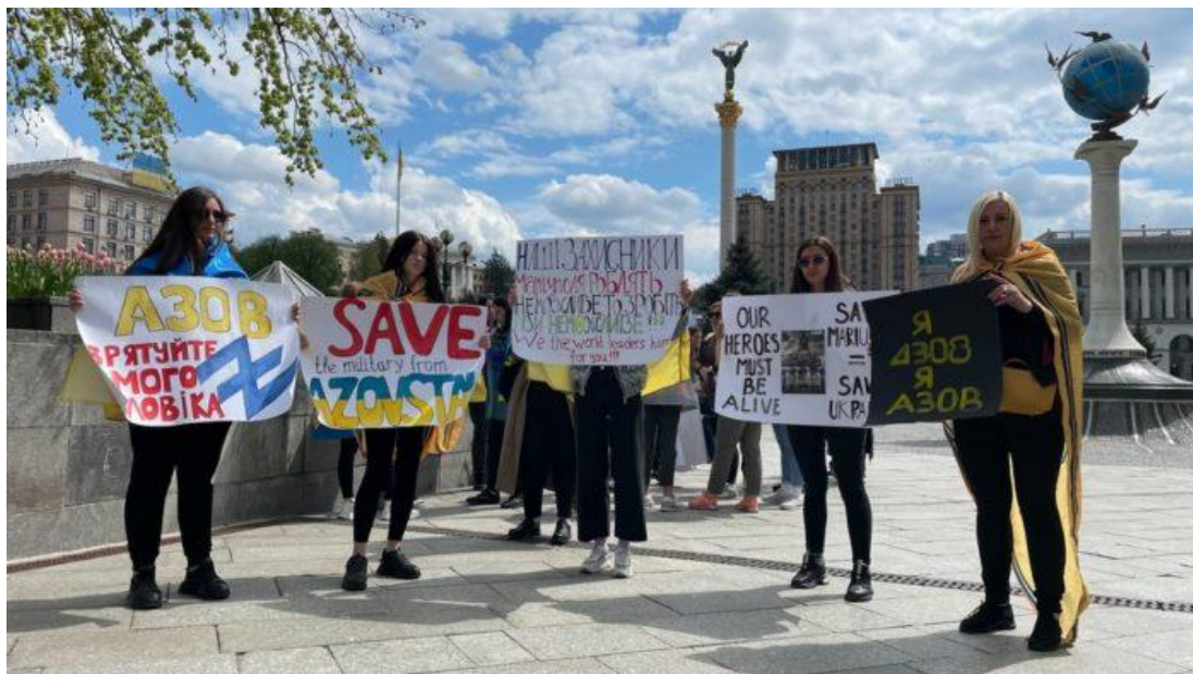
Рис. 3.10. Фото з перформансу у Києві

як важливо не забувати про той жах який коїться там. Люди демонстрували плакати, плакали і стояли у підтримку наших військових.