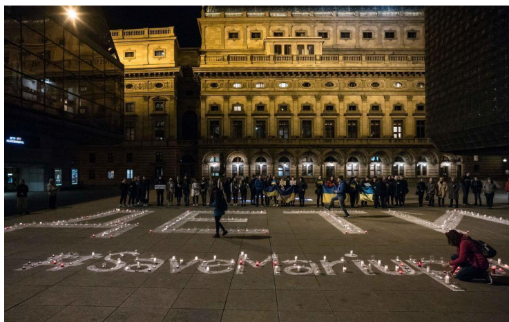
Рис. 2.1. Фото з перформансу у Празі

Чеські театри долучилися до акції «Світло для Маріуполя». На площі перед Національним театром у Празі засвітився напис «ДЕТИ», створений зі свічок.