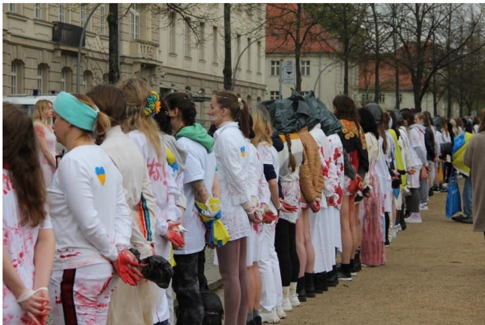
Рис. 2.7. Фото з перформансу у Берліні

5. Ланцюг з жінок, які стоять у кривавому одязі перед німецькими міністерствами символізуючи українську ціну за німецьку теплу зиму з газом.