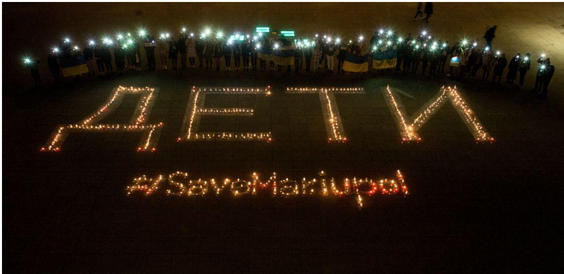
Рис. 3.3. Фото з перформансу у Празі

Окремо можна виділити дві роботи вже доволі відомих людей мистецтва. Першою є Марина Абрамович, котра через 12 років повторить один з із своїх найвідоміших перформансів «У присутності Художника», квитки продавалися у форматі аукціону, а зібрані кошти пішли на користь Україні. Він приходив 16 квітня у Sean Kelly Gallery. Таким масштабним повернення вона показує солідарність з Україною. Гадаємо однією з ключових причин її позиції, є те що одна з її робіт була створена у Бабиному Яру, що у свою чергу говорить про важливість для неї цього місця. Тож навряд чи вона могла залишитися байдужою після того як російські окупанти здійснили ракетний обстріл цього місця [19, 23]