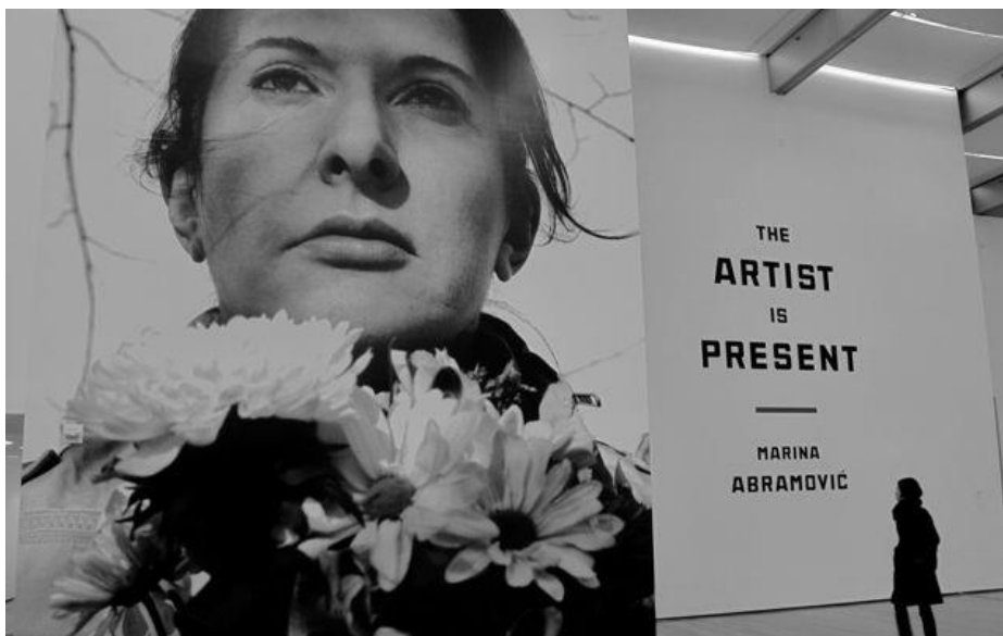
Рис. 2.2. Фото для перформансу Марини Абрамович

2. Художниця сербського походження Марина Абрамович вирішила відтворити свій найзнаменитіший перформанс «У присутності художника» заради підтримки України