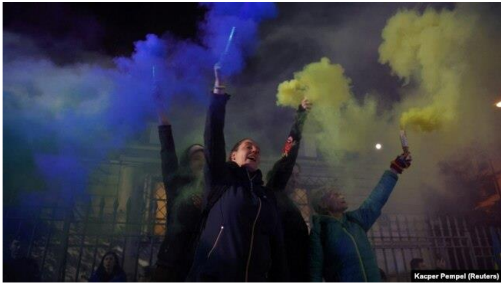
Рис. 2.8. Фото з перформансу у Варшаві

7. Кафе «Київ» відкрили 27.02.2023 в Берліні. На роковини від повномасштабного вторгнення кафе «Москва» перейменували саме на «Київ».