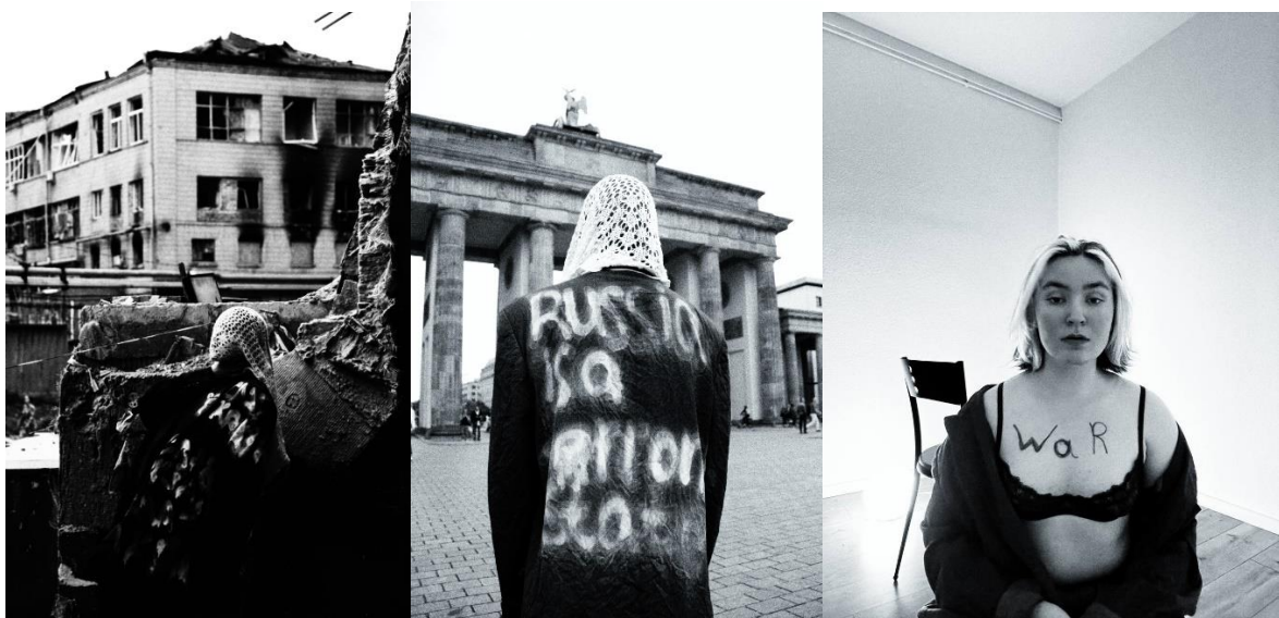
Рис. 3.14. Проект «Правда» частина 1,2,3.

Другою частиною самої виставки були «Символи» тобто ті атрибути, які відсилаю людину до війни, те що дає тобі зрозуміти що звичні речі такими вже ніколи не будуть.