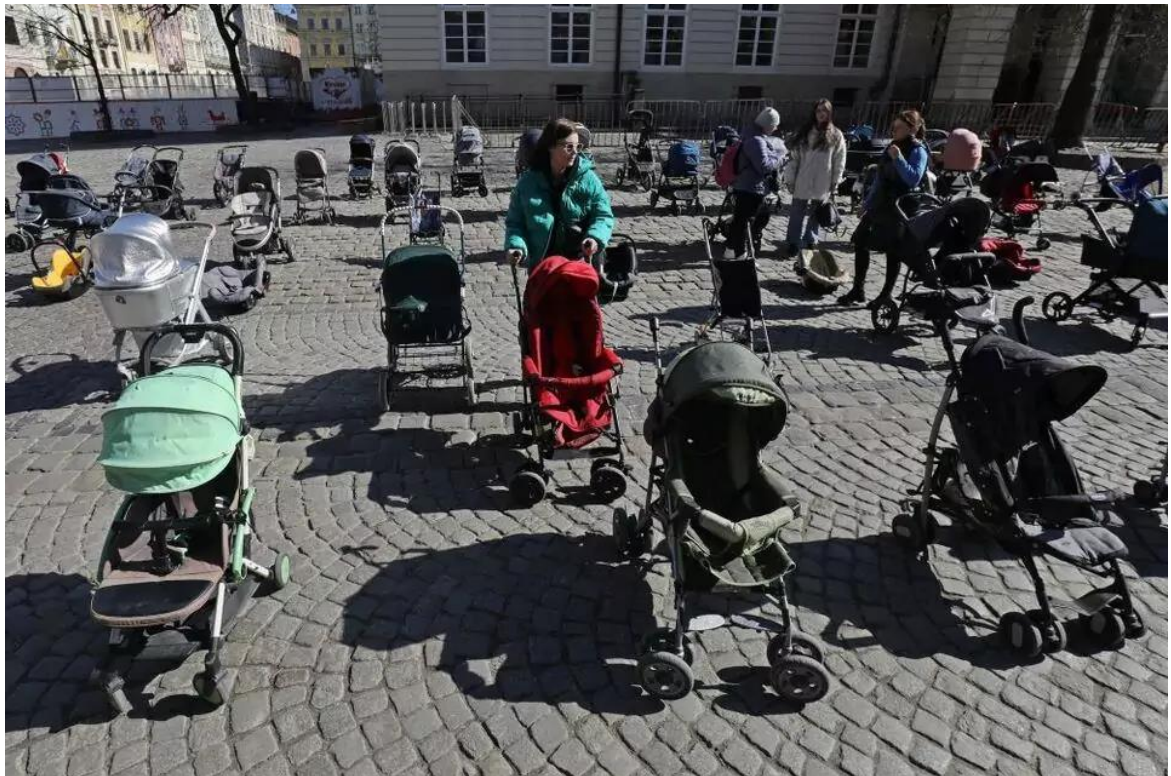
Рис. 3.2. Фото з перформансу у Львові

З цього перформансу взяли приклад декілька інших міст, так, наприклад, у Каліфорнії українська діаспора виклала 128 пар дитячого взуття перев'язаного синьо-жовтими стрічками. Цим вони хотіли нагадати, що війна