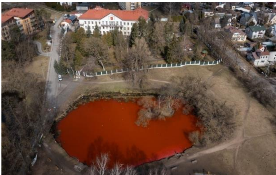
Рис. 3.4. Фото з перформансу у Вільнюсі

у якій литовська плавчиня та олімпійська чемпіонка Рута Мейлутіте перепливла криваве озеро. Це було сфотографовано фотографкою Нерінгою Рекашюте, і пізніше розповсюджено у мережі. Ці естетичні з вигляду, але жахливі по суті знімки швидко розлетілися інтернетом і вже у свою чергу стали причиною наступної акції, у якій приймали участь кілька десятків литовців, котрі одягнули білі одежі і разом взявшись за руки зайшли у воду. Показавши цим що вони не тільки солідарні з Україною, але й не бояться Росії.