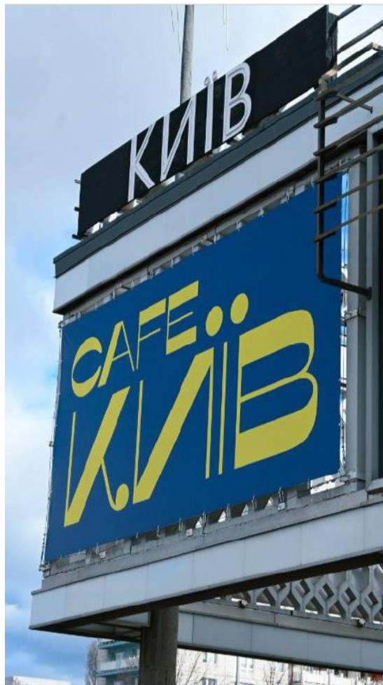
Рис. 2.9. Фото з акції у Берліні

7. Кафе «Київ» відкрили 27.02.2023 в Берліні. На роковини від повномасштабного вторгнення кафе «Москва» перейменували саме на «Київ».