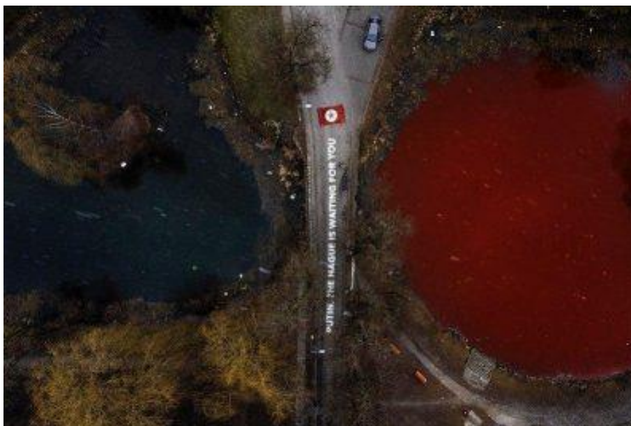
Рис. 2.3. Фото з перформансу у Вільнюсі

3. Акція під час якої одне з озер біля посольства Російської Федерації у Вільнюсі перетворилося на «криваве море».