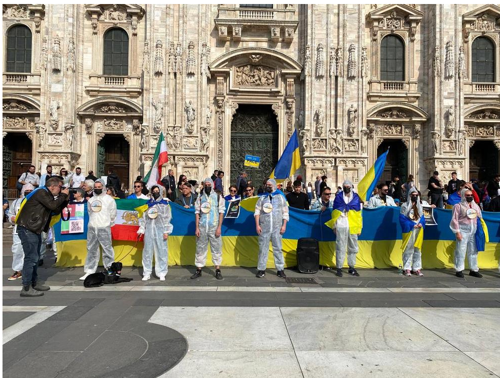
Рис. 2.9. Фото з перформансу у Італії

8. 21 – 23 квітня з нагоди Міжнародного дня Землі в усьому світі відбулись акції під назвою EcoUnity For Ukraine у рамках кампанії #StopEcocideUkraine.