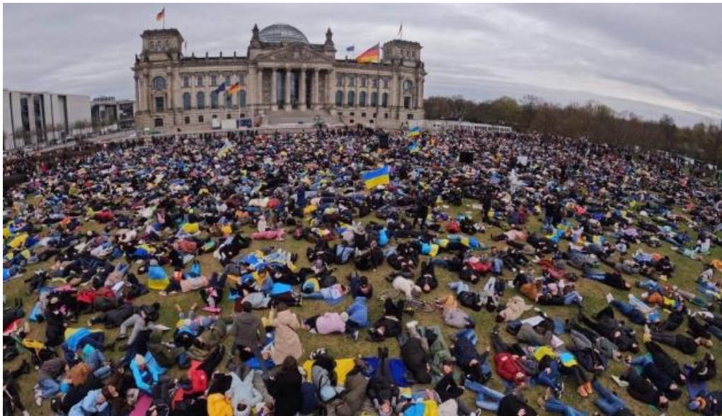
Рис. 2.6. Фото з перформансу у Берліні

5. Ланцюг з жінок, які стоять у кривавому одязі перед німецькими міністерствами символізуючи українську ціну за німецьку теплу зиму з газом.