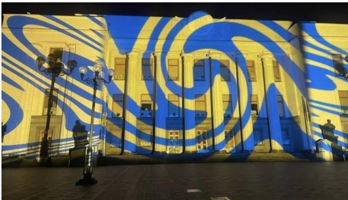
Рис. 2.10. Фото з перформансу у Києві

9. Митець зі Швейцарії Геррі Хофштеттер у межах арт-туру «Вшанування пам'яті. Світло для надії» підсвітив синьо-жовтими кольорами та символічними проєкціями будівлю Верховної Ради.