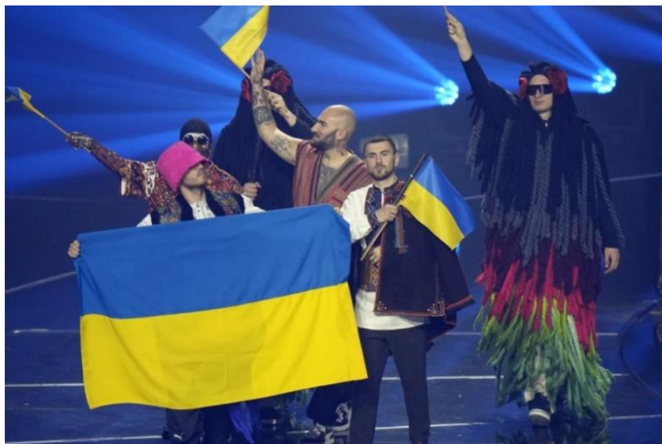
Рис. 3.11. Фото з виступу Kalush Orchestra у Турині

Найбільш свіжою подією є перемога групи Калуш Оркестра на Євробаченні 2022 у Турині. У кінці одного зі своїх виступів вони закликали врятувати людей, котрі перебувають на території заводу Азовсталь у Маріуполі.