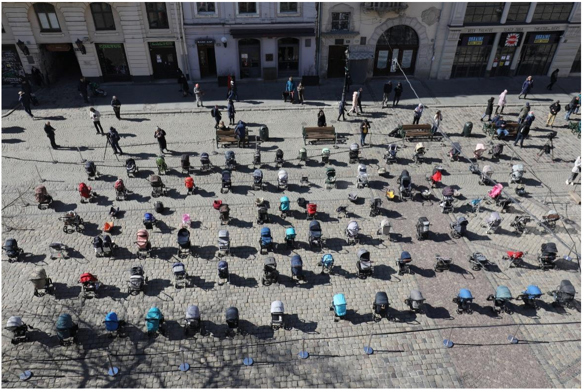
Рис. 3.1. Фото з перформансу у Львові