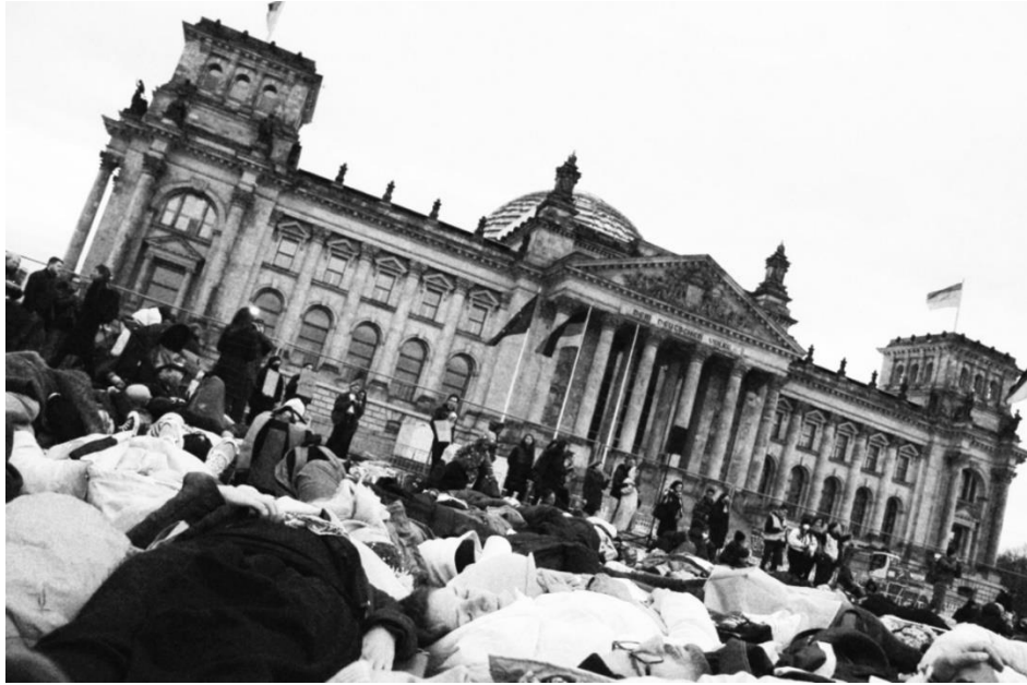
Рис. 3.7. Фото з перформансу у Берліні

Другим важливим берлінським перформансом був ланцюг з жінок одягнених у кривавих одяг. Він був покликаний показати якою ціною дістається Німеччині газ та нафта, ціною життів зґвалтованих жінок та дітей.