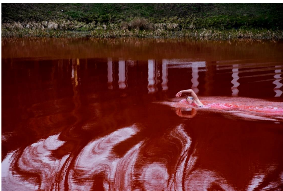
Рис. 3.5. Фото з перформансу у Вільнюсі