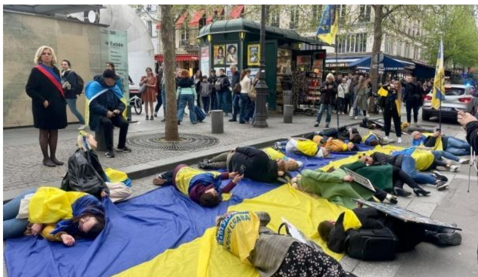
Рис. 2.10. Фото з перформансу у Франції

8. У Парижі українські та французькі активісти провели акцію протесту проти французьких компаній, що працюють на російському ринку, попри терористичну та геноцидну агресію рф щодо України.