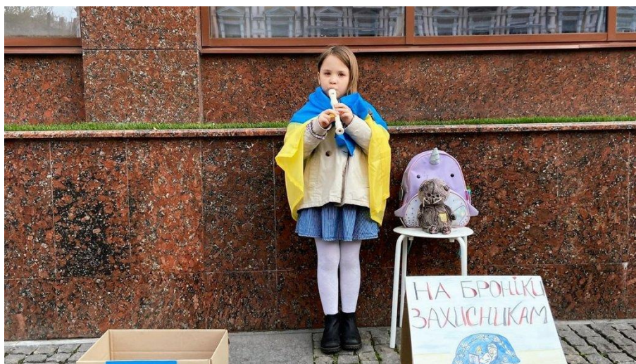
Рис. 3.9. Фото з перформансу у Дніпрі

Завдяки таким здавалося б маленьким історіям Україні вдається не втрачати бойовий дух і боротися за свою свободу.