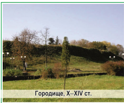
Городище, X–XIV ст.

Багата історико-культурна спадщина району, у т. ч. сакральна (численні об'єкти екскурсійного показу), сприяє розвитку пізнавального (екскурсійного), релігійного, паломницького та етнічного видів туризму, зміст яких зводиться не лише до відвідування місць походження родини, "землі предків", а й до ознайомлення із традиційною культурою місцевого населення. Відродження старовини – це спосіб розвитку етнографічного туризму, а в районі є унікальні локації, що у перспективі можуть стати успішними центрами етнографічного туризму. Осередками народних художніх промислів та декоративно-прикладного мистецтва є: м. Володимир-Волинський (ткацтво, писанкарство, вишивка), сс. Нехвороща, Сілець (писанкарство), с. Хмелівка (вишивка), с. Пархоменкове (вишивка, писанкарство).