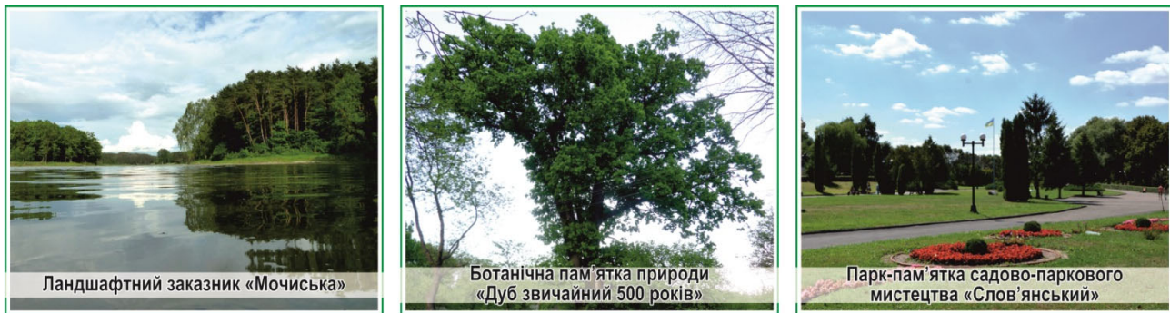
Рис. 3. Природоохоронні об'єкти Володимир-Волинського району [10]