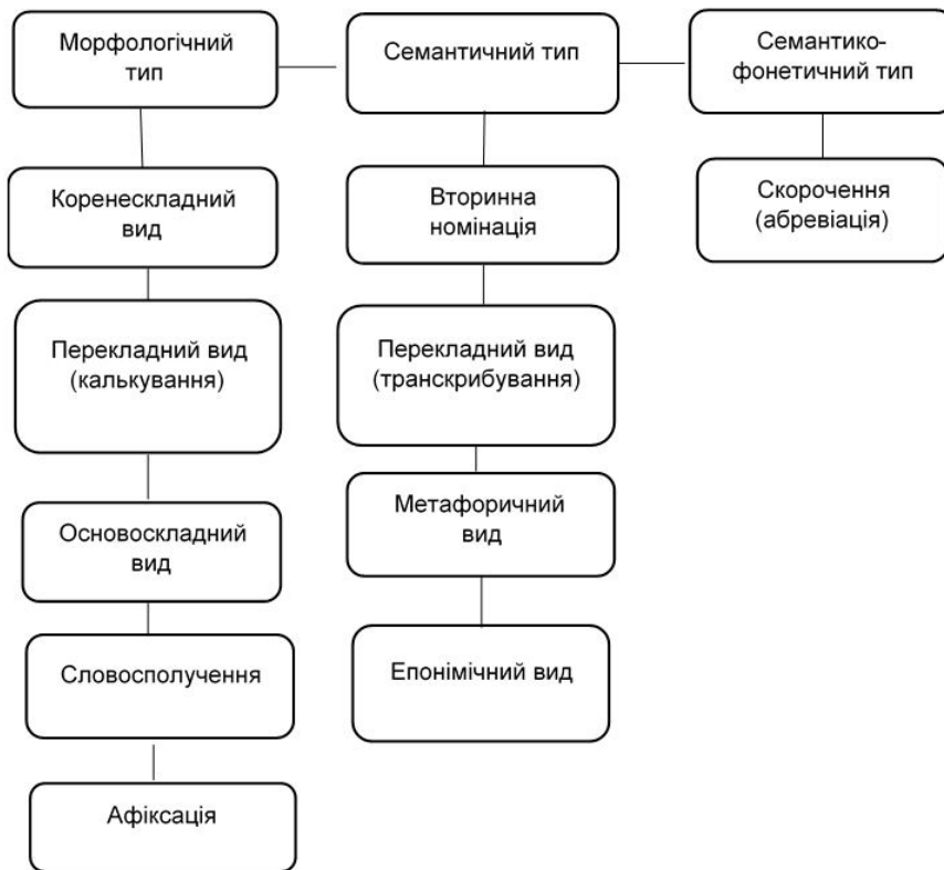
Рис. 1. Типи, види та ступені вмотивованості японської літературознавчої термінології

Більшість одиниць японської літературознавчої термінології становлять вмотивовані терміни (73,5 %), і це зумовлено, на нашу думку, термінотворчими факторами, зокрема тим, що більшість одиниць фахової мови японського літературознавства є коренескладними, які своєю чергою мають прозору семантику.