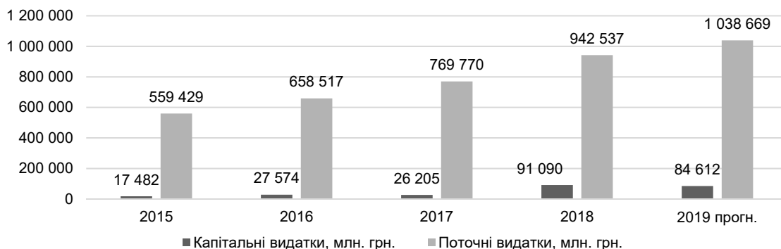
Рис. 3. Обсяг видатків державного бюджету у 2015–2019 рр. у розрізі економічної класифікації видатків, млн грн

Динаміке капітальних та поточних видатків державного бюджету за останні п'ять років показані на рис. 3.