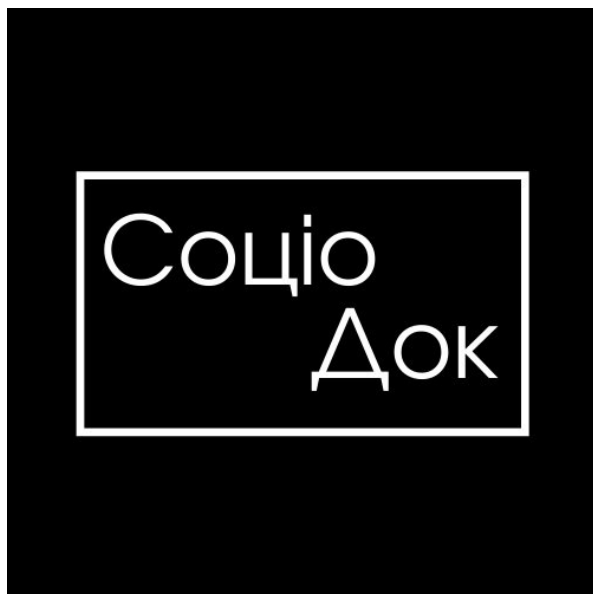
1. Логотип проєкту

Ідея інноваційного проєкту «Соціально-документальний театр «Україна. СоціоДок» у поєднанні двох галузей. На основі журналістської роботи буде створено майданчик для розвитку першого в Україні соціально-документального театру.