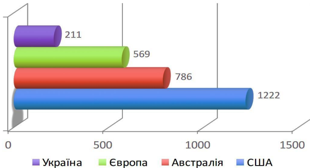
Рис. 2.1. Кардіохірургічні операції на мільйон населення (2014) [80]

країні недостатня кількість кардіохірургічних центрів. Відповідно в Україні здійснюється набагато менше оперативних втручань (рис. 2.1).