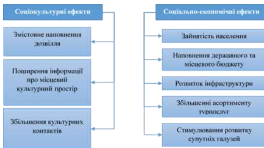
Рис. 3 Ефективність розвитку івент-туризму в регіоні

Результатом реалізації івент-стратегії буде досягнення сукупних ефектів, зокрема соціокультурного та соціально-економічного, які представлено на рис. 3.