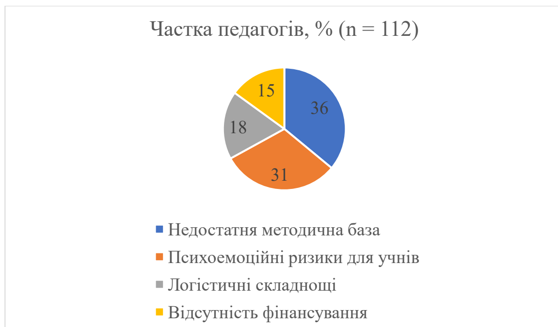
Рис. 2.3 – Педагогічна оцінка труднощів освітніх виїздів, акцій допомоги, організованих заходів (за результатами власного спостереження)