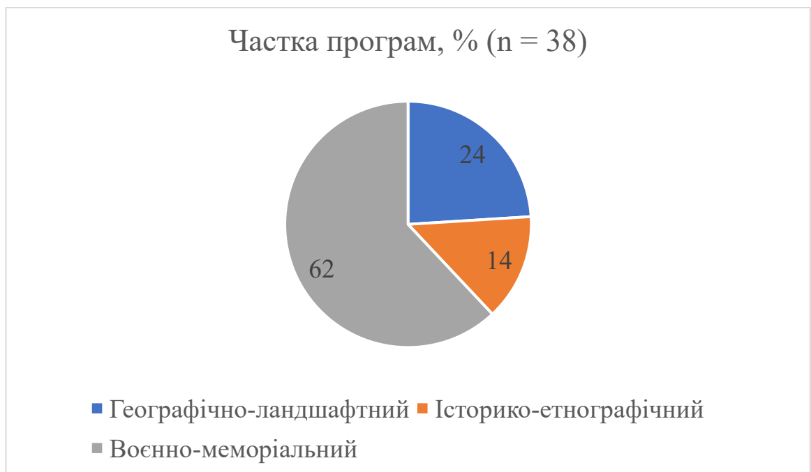
Рис. 2.2 – Розподіл тематичних акцентів гурткових програм (за результатами власного спостереження)

нараховано 38 гуртків, охоплення учнів – 9,7 % від усіх школярів 7-11 класів. Спостереження засвідчило, що у 62 % гуртків тематичне ядро зміщене з «географії рідного краю» до «воєнно-меморіального» напрямку, відображаючи суспільний запит. Найчастіші активності – обробка фотографічних архівів (78 %), догляд за могилами та меморіальними таблицями (54 %), організація «живих бібліотек» із ветеранами (31 %). Систематичний брак спеціалізованих підручників і сучасного обладнання позначено як ключову перешкоду (71 % наставників) (рис. 2.2):