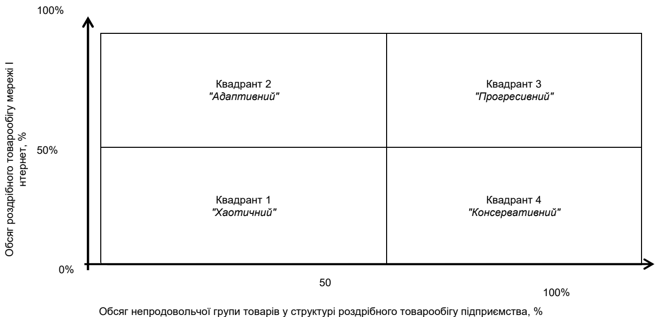
Рис. 3. Матриця можливостей стратегічного перетворення підприємств роздрібною торгівлі

На основі отриманих висновків і запропонованих авторами тверджень пропонується матриця оцінки можливостей стратегічного перетворення підприємств ритейлу з метою подальшого цільового аналізу суб'єктів господарювання роздрібною торгівлі (рис. 3). Запропонована матриця можливостей створена на основі сполучення двох показників – частки непродовольчих товарів у товарній групі та частки роздрібного товарообігу мережі Інтернет. Застосування першого показника обумовлено тим, що не всі підприємства роздрібною торгівлі спеціалізуються виключно на товарах промислової або непромислової групи, а відповідно до стратегії блакитних океанів ініціатором створення нового ринкового простору може виступати будь-який суб'єкт господарювання. Однак, ураховуючи сучасні тенденції розвитку, підприємства з вищою спеціалізацією та непродовольчим характером мають більшу потребу в перетвореннях.