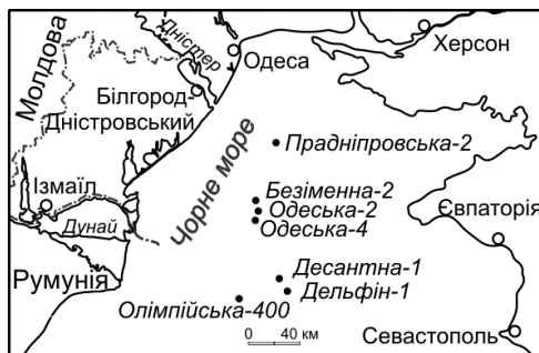
Рис. 1. Схема розташування свердловин на Чорноморському шельфі

Отримані нами нові дані показали, що послідовність розрізу, розкритого свердловиною Прудніпровська-2, порушена внаслідок тектонічних процесів. Аналіз гідрогеологічних ознак нафтогазосності дозволив визначити, що нижньокрейдові та майкопські відклади Прудніпровської площі є перспективними на вуглеводні.