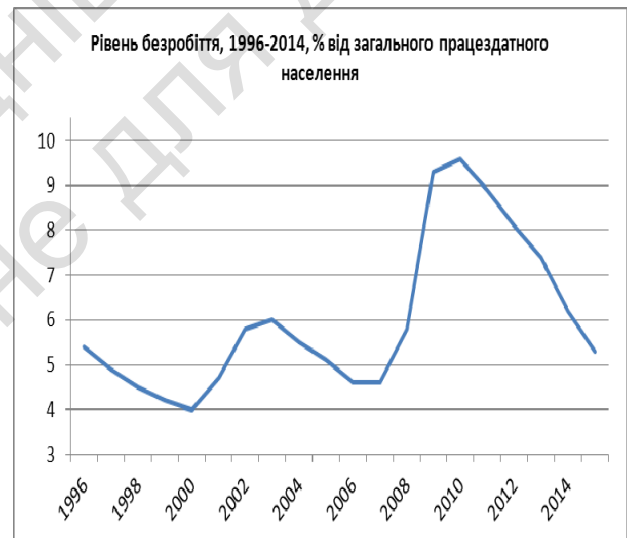
Рис. 1. Динаміка ВВП та рівня безробіття у США, 1996–2014 рр. [14], [16]

По-перше, починаючи із 1980-х рр., у США спостерігається стала тенденція до посилення нерівномірного розподілу доходу між найбагатшими та найбіднішими верствами населення (рис. 2). Починаючи із 2009 р., ця тенденція лише погіршилась. У 2011 р. країну сколихнула серія масових вуличних протестів, що розпочалися з акції "Окупуй Уолл-Стріт!". Головною вимогою було врегулювання державою ситуації із несправедливим розподілом суспільних благ. Акція відбувалася на тлі наслідків економічної кризи 2008 р., яка була спровокована кредитними махінаціями провідних фінансових корпорацій. Саме тому жорстка риторика стосовно фінансових корпорацій із Уолл-Стріт активно використовувалася під час праймеріз як конкурентом Х. Клінтон від демократичної