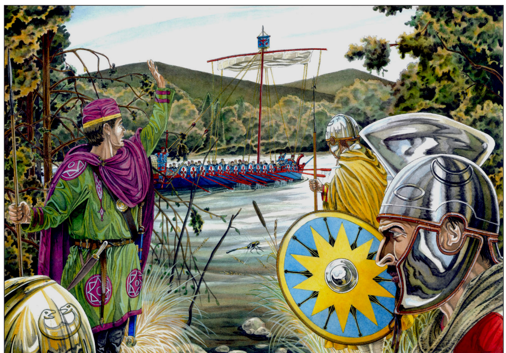
Іл. 3. Miles із числа магістерію Фракії патрулюють Дунай або його притоки, IV–VI ст.

Подальше перетікання бойових дій описано Феофілактом та Феофаном стисло. За наративом «Історії», після перемовин відбулась «стрімка атака римлян» на передмістя Сингідуну з південних берегів Дунаю та Сави (Theophylact 1986, р. 229). Імовірно, мова йшла про атаку обох мер магістерія, очолюваних Пріском та Гудуїном. Дії римлян були раптовими – кочовики здійснили спробу організувати оборону, «спорудивши із возів частокіл» перед містом, однак «почали тікати», очікуючи нападу зі сторони містян Сингідуну, яких не було переселено (Theophylact 1986, р. 229). «Хронографія» при цьому вказує на прецедент нетривалої облоги