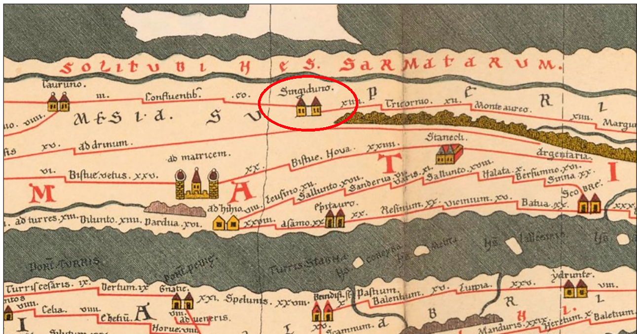
Іл. 1. Сингідун, зображений на «Пейтингеровій мапі» (Секція VII, Паннонія, Верхня Мезія та Далмація).

Перейдемо до стислої характеристики дипломатії між сторонами у регіоні Дунаю. З огляду на наявність залоги та фортифікацій у місті, Баян спрямував певну частину орди до Сингідуну лише у 581 р. винятково з метою переговорів із тодішнім командиром гарнізону, дуксом Мезії I (лат. dux Moesiae Primae ) Сіфом (лат. Sethus , грец. Σεθού) (Menander 1985, р. 218–223). Принагідно зауважимо, що населений пункт належав до адміністрації дукса цієї провінції ще з V ст., як місце постійної дислокації exercitus (Notitia Dignitatum 1876, р. 93).