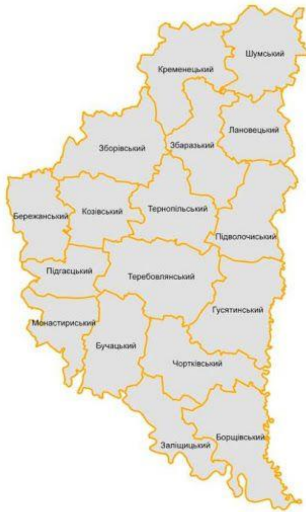
Рис. 2.1 Склад Тернопільської області