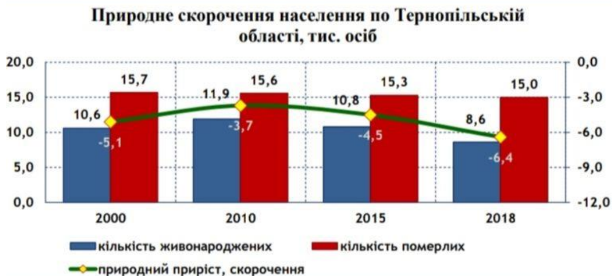
Рис. 2.2 Природне скорочення населення по Тернопільській області