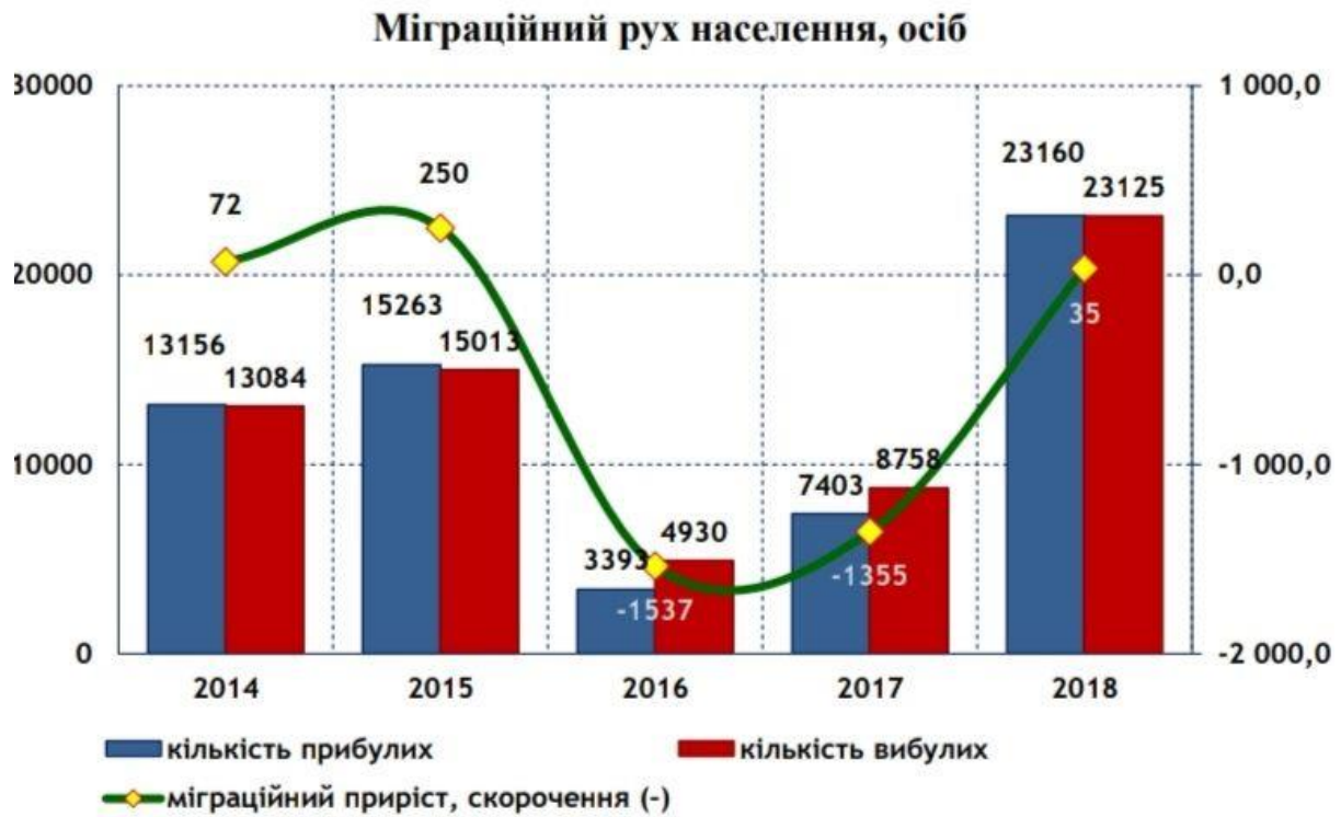
Рис. 2.3 Міграційний рух населення