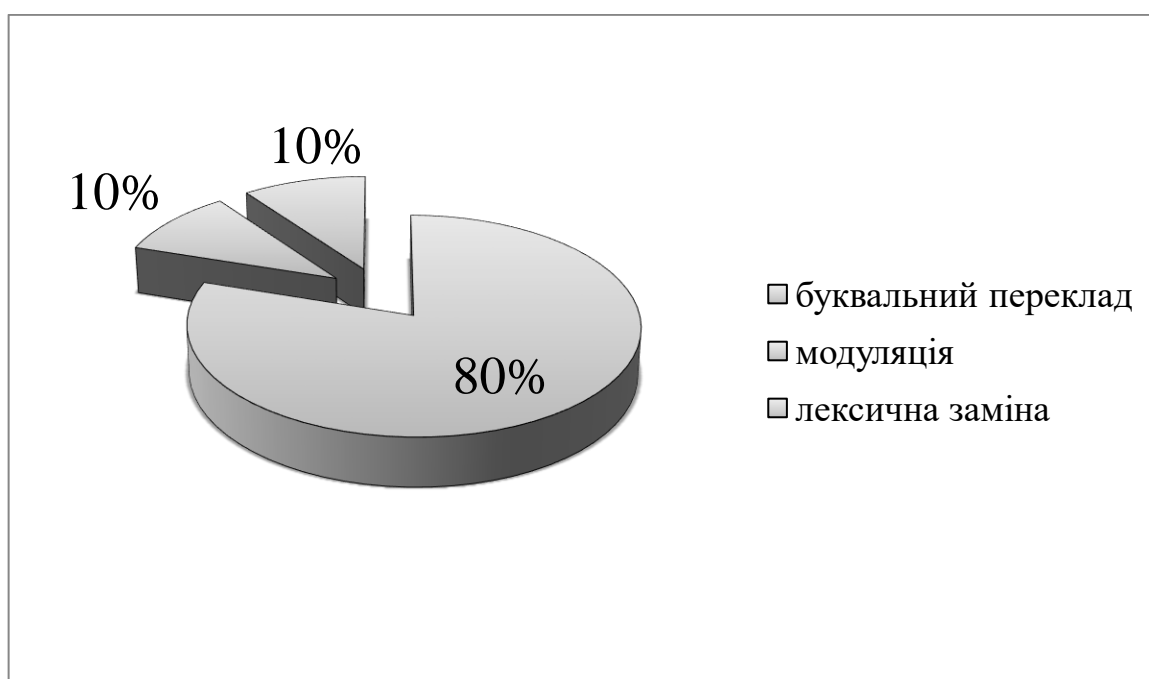
Рис. 3.2. Засоби перекладу сленгізмів в індонезійських піснях

Результати перекладу викладено в рис. 3.2: