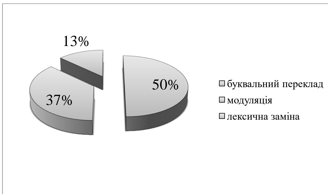
Рис. 3.3. Засоби перекладу діалектизмів в індонезійських піснях

Результати перекладу діалектизмів зображено в рис. 3.3: