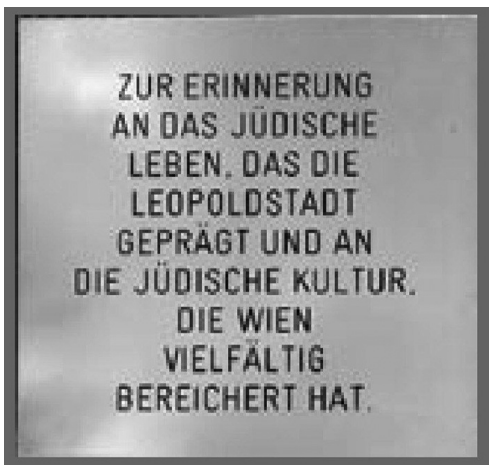
Іл. 3, іл. 4. Меморіальні таблиці встановлені поруч з Синагогою по вулиці Темпельгассе 3/5. Джерело: Weg der Erinnerung durch die Leopoldstadt. Erinnerung an das jüdische Leben Gedenken an die jüdischen Einwohnerinnen. Station 1–17. 2006. S. 7.

були підпалені, а згодом зруйновані. У пам'ять про них були встановлені меморіальні дошки.