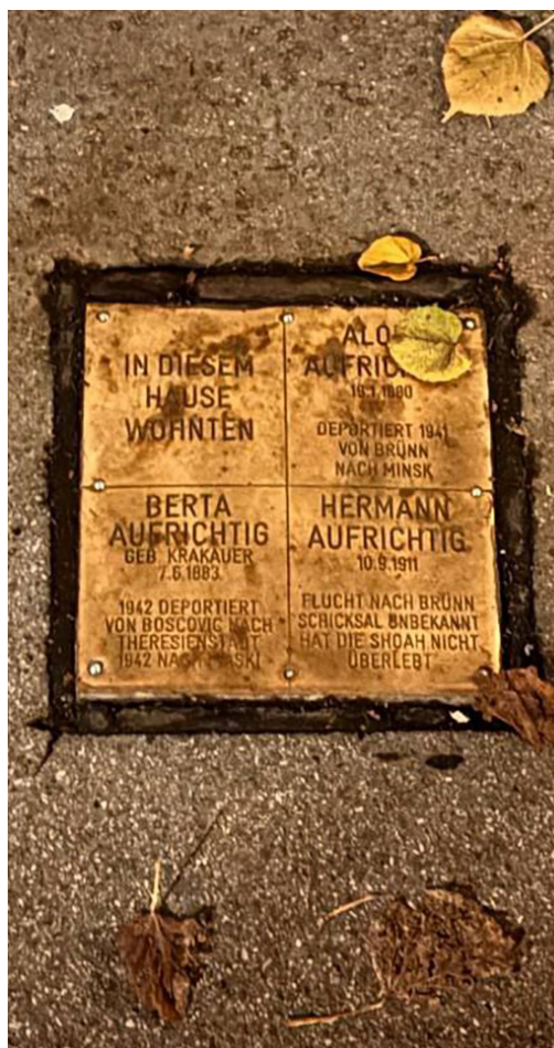
Іл. 6. Меморіальна дошка родини Ауфріхтіг. Вулиця Ібштрассе 5. Відень. Фото Катерини Потьомки ( листопад 2025 р.).