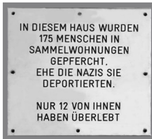
Іл. 5. Меморіальна дошка на вулиці Конрадгассе 1. Відень.

Ніна Лустіг, народжена 29 вересня 1876 року, депортована 17 липня 1942 року з Відня до Освенцима. Вбита під час Голокосту (Steine der Erinnerung: Familie Aufrechtig).