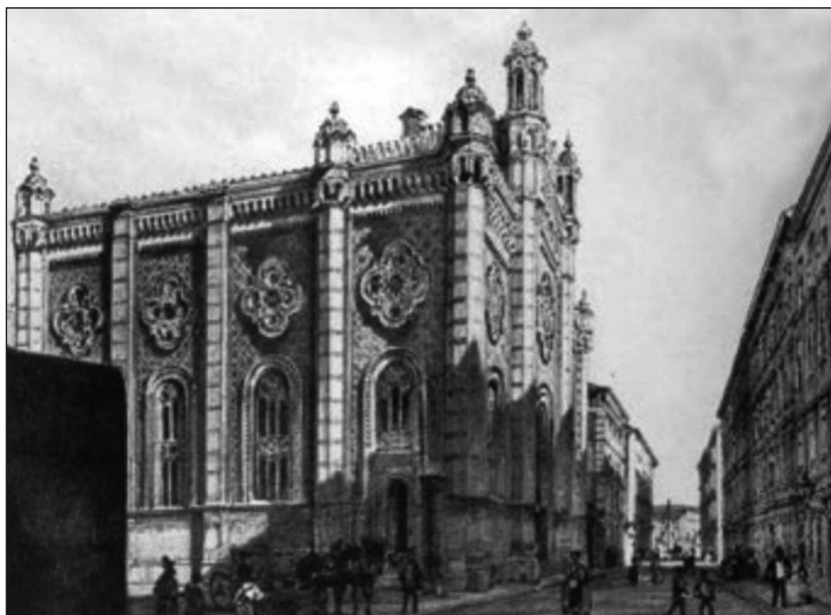
Іл. 2. Леопольдштадська синагога (Темпл). Фото поч. XX ст.