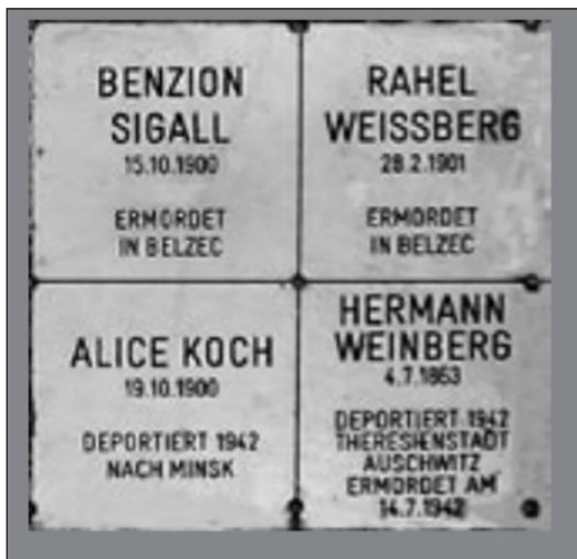
Іл. 9. Меморіальна дошка на вулиці Пратерштрасе 36. Джерело: Weg der Erinnerung durch die Leopoldstadt. Erinnerung an das judische Leben Gedenken an die judischen Einwohnerinnen. Station 1–17. S. 10.

Відомо, що вулиця Пратерштрасе була центром єврейського театру. Численні мандрівні трупи ставили тут театральні вистави мовою ідиш. Такі кабаре-ансамблі, як Будапештський Орфей, розпочали свою кар'єру в Леопольдштадті та зверталися не лише до єврейської аудиторії, а й ставили вистави австрійцям. Найбільш відомими були «Г'єси єврейських артистів» та «Сцена Роланда». Багато єврейських театральних проєктів закрилися на початку 1930-х рр. Єврейських акторів та кабаре-артистів переслідували, вбивали або змушували емігрувати націонал-соціалісти (Weg der Erinnerung durch die Leopoldstadt 2006, s. 11).