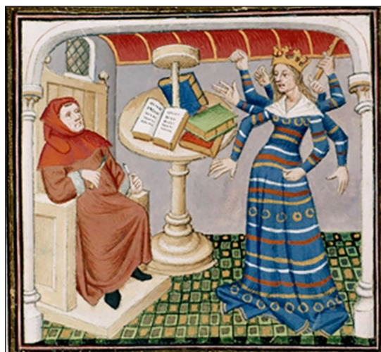
Іл. 3. BL, Royal 20 C IV, f. 198.

більшості мініатюр XV ст. богиня постає поруч із Колесом. Це свідчить про процес формування усталеної іконографічної традиції навколо зображення Фортуни і саме тоді Колесо стало основним атрибутом богині долі. Також важливо, що в межах тогочасного теологічного світобачення Фортуна не сприймалася як богиня чи божество. Але надприродні можливості впливати на людські долі не викликали сумніву.