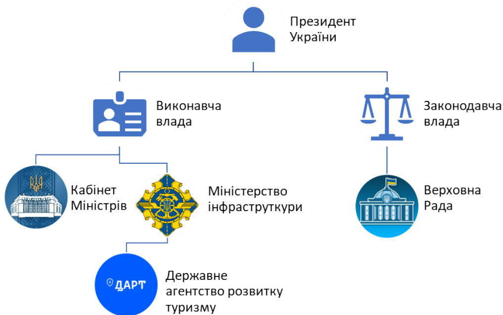
Рис. 1. Органи, що здійснюють регулювання в галузі туризму в Україні

Державне агентство розвитку туризму України (ДАРТ) є центральним органом виконавчої влади, діяльність якого спрямовується і координується Кабінетом Міністрів України через Міністерство інфраструктури України і який реалізує державну політику у сфері туризму та курортів (крім здійснення державного нагляду (контролю) у сфері туризму та курортів). ДАРТ у своїй діяльності керується Конституцією та законами України, указами Президента України та постановами Верховної Ради України, прийнятими відповідно до Конституції та законів України, актами Кабінету Міністрів України, іншими актами законодавства (State Agency for Tourism Development of Ukraine, 2021).