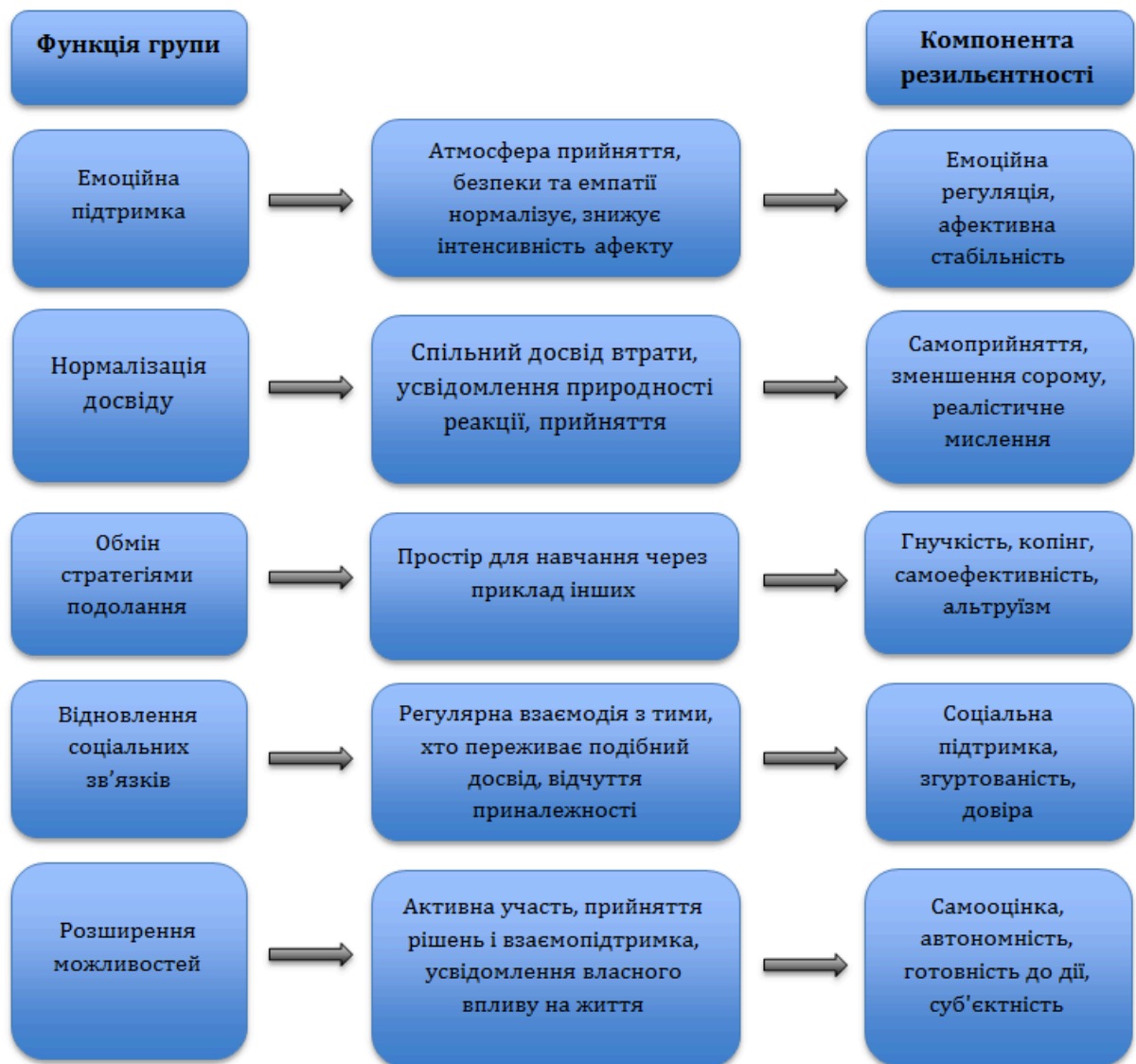
Рис. 1.1. Теоретична модель взаємозв'язку функцій групи до компонент резильєнтності

Таким чином, групи підтримки слугують важливим ресурсом для зміцнення резильєнтності людей і громад, які постраждали від травми, особливо в контексті горя, кризи та колективних втрат. Зрештою, групи підтримки, за умови етичного сприяння та соціальної підтримки, стають