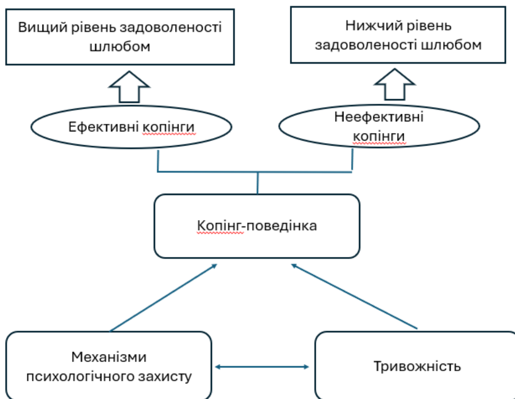
Рис. 2.1 Концептуальна модель дослідження