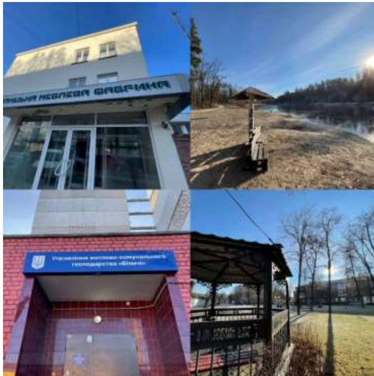
Рис.3. Громадський центр «Меблева» (* складено автором)

вибору цього місця, стан обраних для відпочинку публічних просторів, ступінь потреби в їх змінах чи доповненнях.