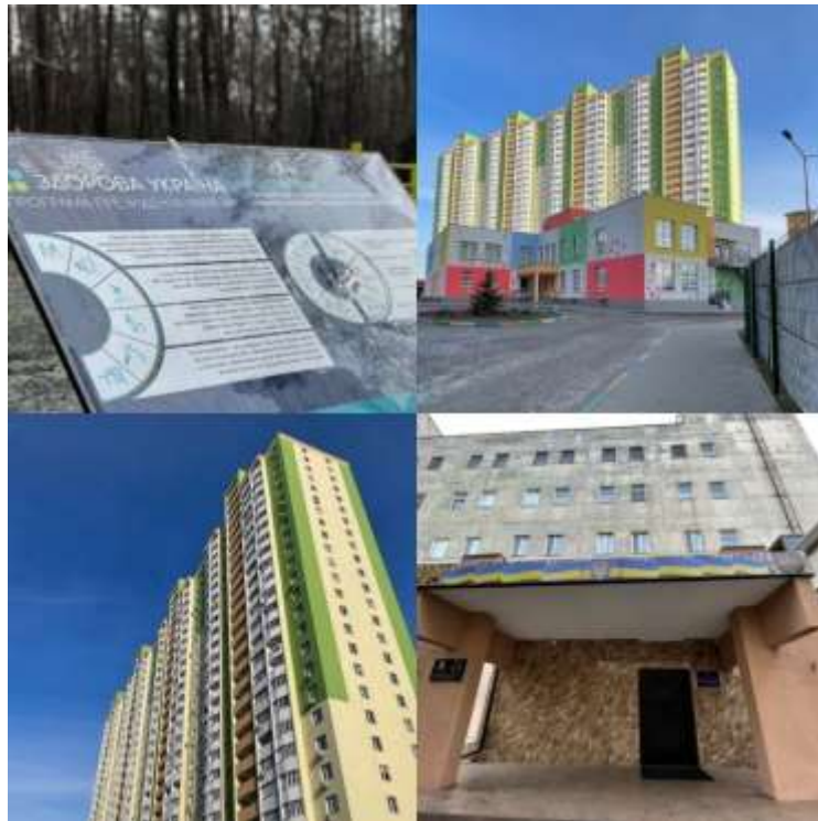
Рис.5. Громадський центр «Атлант» (* складено автором)