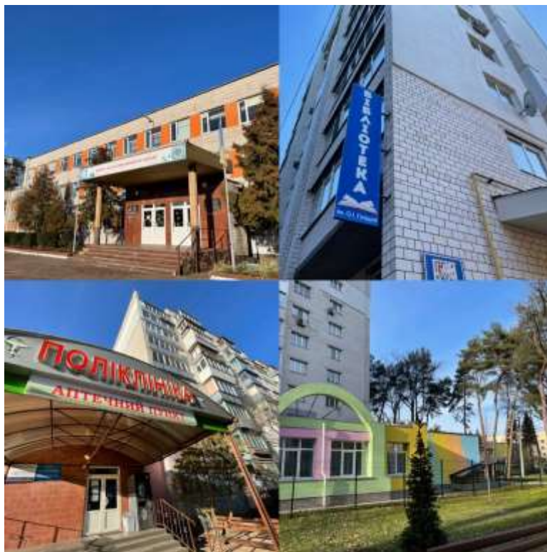
Рис.4. Громадський центр «Школа» (* складено автором)