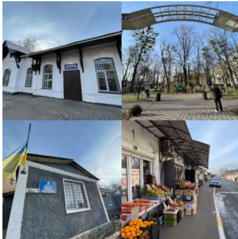
Рис.2. Громадський центр «Центральний» (* складено автором)