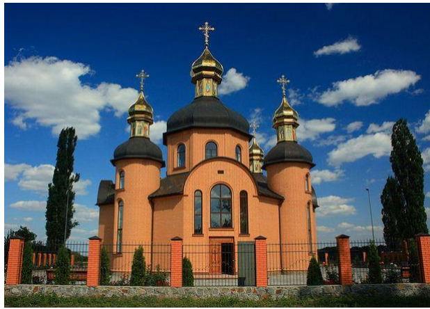
Рис. 5. Вірменська церква у Голованівську

Що стосується Криму, то тут існує чимало храмів та інших будівель, збудованих за вірменськими (рідше грузинськими) архітектурними традиціями, зокрема у Керчі, Феодосії, а також у Гаспрі, Ореанді, Лівадії – населених пунктах Великої Ялти, де є храми, зведені не вірменами, але дуже схожі на вірменські. Але найгарнішим вірменським храмом в Україні вважається церква Св. Ріпсіме у Ялті, що була зведена на кошти заможного бакинського нафтопромисловця, мецената і вірменина за національністю Погоса Тер-Гукасяна (якого росіянам зручніше було називати Павлом Осиповичем Гукасовим). Архітектором храму для вірменської громади Ялти був запрошений ще один відомий вірменин, який тривалий час працював у Баку та виконував архітектурні замовлення того ж Тер-Гукасяна та інших нафтопромисловців – Габріель Тер-Мікелян. За основу для церкви Св. Ріпсіме архітектор узяв ескіз однойменного, легендарного для вірмен, храму в Ечміадзіні, але значно переробив його. Хоча існуюча церква Св.Ріпсіме у Ялті нагадує своїми обрисами й деякими деталями вірменську святиню VII ст., але загалом цей храм є унікальним і неповторним, адже відрізняється за масивністю (оригінальний храм більш приземкуватий), кольором (для будівництва використали сирій фороський туф) та декоративним оздобленням.