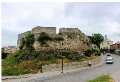
Рис. 3. Вірменський бастион у Кам'янці-Подільському