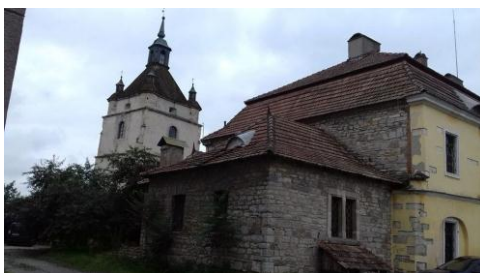
Рис. 2 Дзвіниця Вірменської церкви у Кам'янці-Подільському