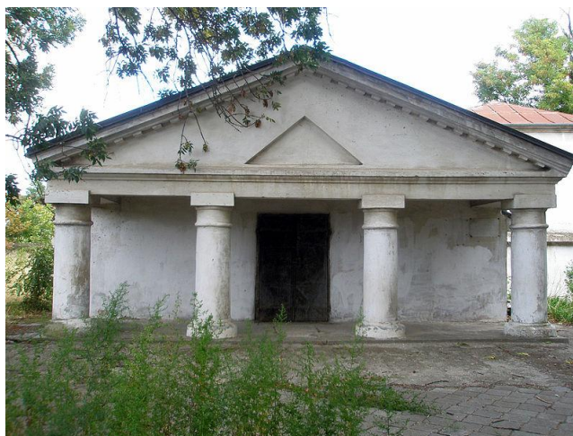
Рис. 4. Вірменська церква у Білгород-Дністровському

У 1995-1997 рр. було проведено реставраційні роботи по зміцненню фундаментів, стін, склепінь, оздоблювальні роботи та благоустрій території. Подейкують, що вірменська громада із Києва планує відновити храм. На території церкви розміщено сарматський склеп, викопаний при розробці піщаного кар'єру на околиці міста.