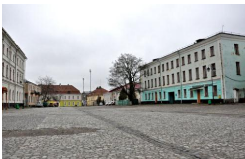
Рис. 4. Площа Вірменський ринок у Кам'янці-Подільському