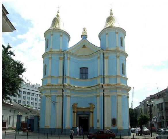
Рис.3 Вірменська церква у Івано-Франківську

Під час Першої світової війни храм зазнав певних руйнувань від німецьких снарядів, які летіли у російський загін, розміщений на церковному подвір'ї, – було пошкоджено фасад і пробито дах. Потім, до 1930 р. проводились відновлювальні роботи. У 1937 р. чудотворний образ Божої Матері було короновано. 1946 р., після приходу радянської влади, ікону вивезли до Польщі і вона нині зберігається у Гданську. Вірменський собор спершу віддали РПЦ, а в 1949 р. - розмістили майстерні художників. Із 1971 р. у приміщенні храму існував музей релігії та атеїзму. Нині вірменський собор Івано-Франківська можна назвати колишнім, адже зараз тут діє Покровський собор Української Автокефальної Церкви. Не так давно храм закінчили реставрувати. У Франківську його часто називають «блакитна церква». Кажуть, всередині збереглися унікальні розписи Яна Солецького. Варто додати, що бувша вірменська церква у Івано-Франківську – мабуть найбільша за площею серед вірменських церков України.