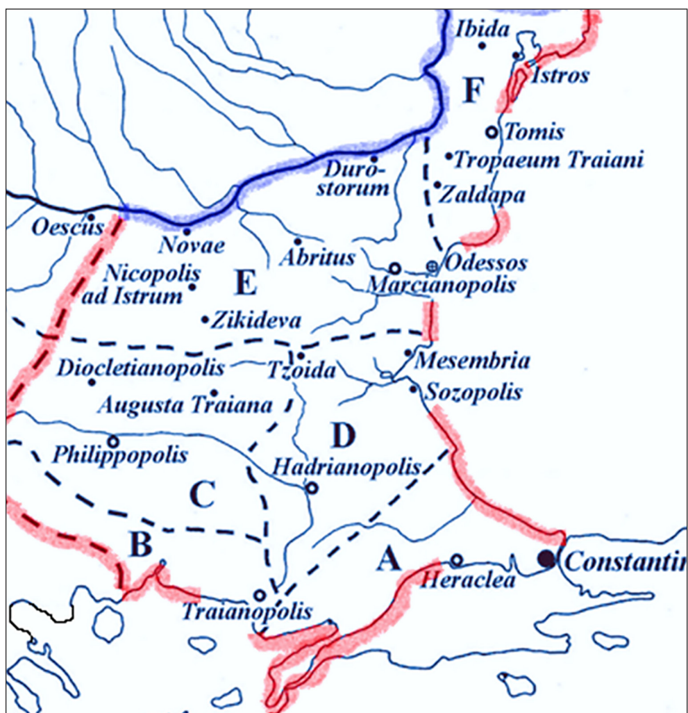
Іл. 1. Адміністративна структура діоцезу Фракія у VI ст. Літерами позначені провінції: А – Еуропа; В – Родопи; С – Фракія; D – Геммимонт; Е – Мезія II; F – Скіфія.

царського складу, а також брак системної підготовки наявних офіцерів (Parnell 2016, р. 75; 97).