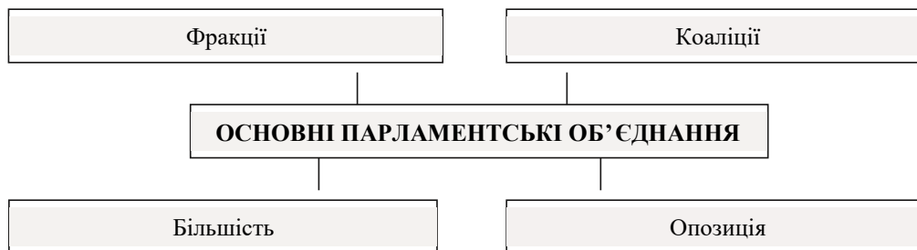
Рис. 1. Структурна класифікація парламентських об'єднань

Спроби утворити та налагодити роботу цих об'єднань мають досить очевидний вплив як на ефективність законодавчого органу, так і на позапарламентську політико-правову діяльність. За типом політичного представництва всі вони мають інституційну складову, оскільки представлені інтереси груп народних депутатів України (рис. 1).