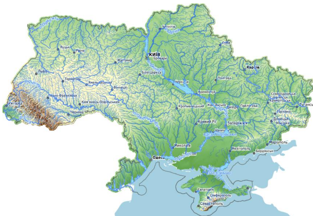
Рис. 1. Гідрографічна мережа території України [9]

На території України налічується понад 63 тис. річок, загальна довжина яких сягає понад 206 тис. км і серед них 3,3 тис. річок мають довжину понад 10 км. Великих річок, довжина яких складає 500 км і більше, налічується 15. Загальний похил території України з півночі на південь, тому переважна більшість річок несе свої води в напрямку до Чорного й Азовського морів. Невеличка частина річок тече в напрямку до Балтійського моря та дуже мала частина річок належать до внутрішнього стоку. Найгустіша річкова мережа у регіонах, де спостерігається найбільша кількість опадів, серед них Карпатські гори (до 1,1 км/км 2 ) та Кримські гори (0,6—0,7 км/км 2 ). Найрідша річкова мережа розташована в південній частині і південному сході країни і наближається до 0 км/км 2 (рис. 1) [2, 7].