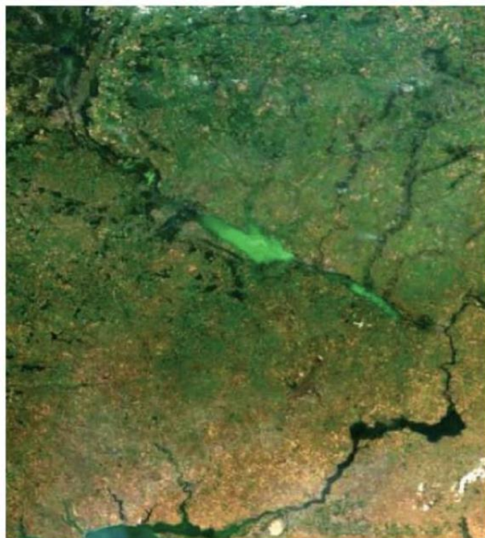
Рис. 4. Дослідження «цвітіння води» в каскаді дніпровських водосховища засобами дистанційного зондування Землі [17]

мають попуски ГЕС, що розташовані вище за течією. Доведено, що в холодну пору року на температуру води помітно впливають також скиди деяких підприємств. На основі супутникових знімків встановлено найважливіші особливості поширення криги по акваторії дніпровських водосховищ. Останнім від криги звільняється Кременчуцьке водосховище, розташоване посередині каскаду і для цього водосховища характерне найбільше «цвітіння» води. Найменше «цвітіння» води спостерігається в Київському водосховищі (рис. 4).