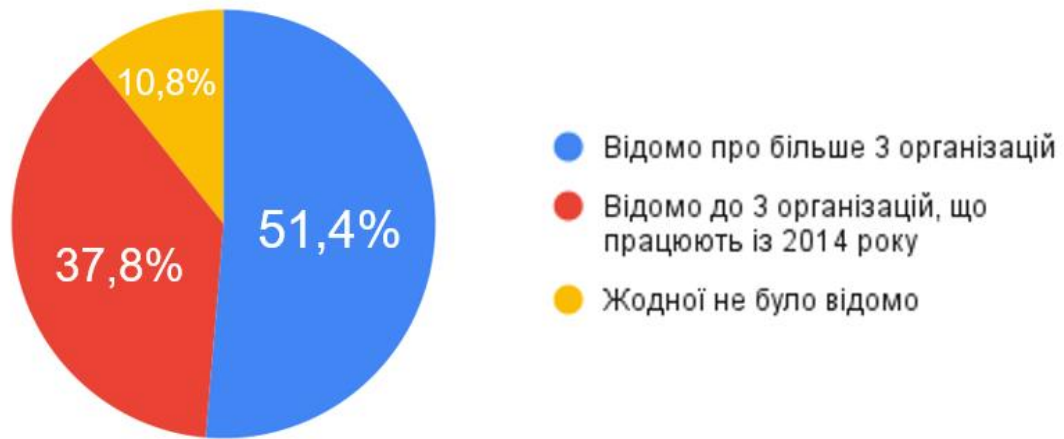
Рис. 2.1. Діаграма відповідей респондентів на питання «Про діяльність скількох громадських організацій, що працюють з військовослужбовцями Вам було відомо/ Ви цікавилися з початку російсько-української війни»