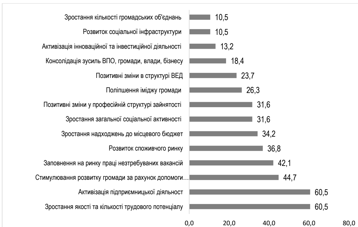
Рис. 4. Розподіл відповідей експертів щодо найбільш вагомих позитивних наслідків інтеграції ВПО у територіальній громаді, де вони проживають, %