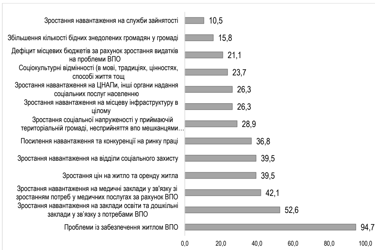
Рис. 3. Розподіл відповідей експертів щодо того, які саме проблеми, зумовлені прибуттям ВПО, найбільш обтяжують місцеві громади, %