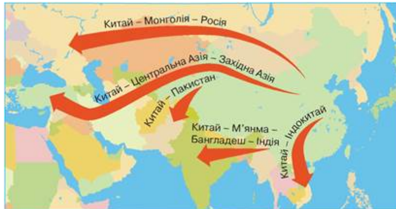
Рис. 3.1. Картосхема економічних інтересів Китаю

лише регіональним лідерством. Сьогодні Комуністична партія Китаю формує новий зовнішньополітичний курс, який позиціонує Китай як сучасну супердержаву, здатну викликати навіть таку супердержаву, як Сполучені Штати Америки. Однак гегемонія Китаю є особливою: вона базується, перш за все, на несилових методах впливу та економічному домінуванні, іншими словами, на використанні "м'якої сили" (soft power) (рисунок 3.1.).