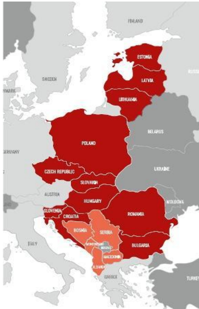
Рис. 3.4. Формат «16+1»

головних цілей форуму був розвиток зеленої енергетики (рис. 3.5).