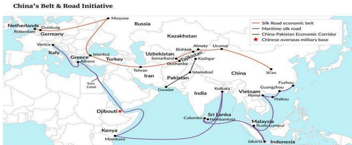
Рис. 3.3. «Пояс-Шлях»