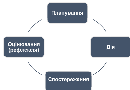
Рис. 1. Етапи дослідження в дії за К. Левіним [10]

Виклад основного матеріалу та результатів дослідження. Одним із основоположників дослідження в дії вважається К. Левін (1946) [10], німецький та американський соціальний психолог. Він розробив спіраль кроків, потрібних для того, щоб генерувати знання про соціальну систему, коли роблять спроби її змінити. Запропонований ним цикл складається з чотирьох основних етапів: 1) планування, яке включає ідентифікацію проблеми, збирання, обробку та інтерпретацію первинних даних; 2) власне дії, 3) спостереження за діями та змінами; 4) відображення або рефлексія (рис. 1).