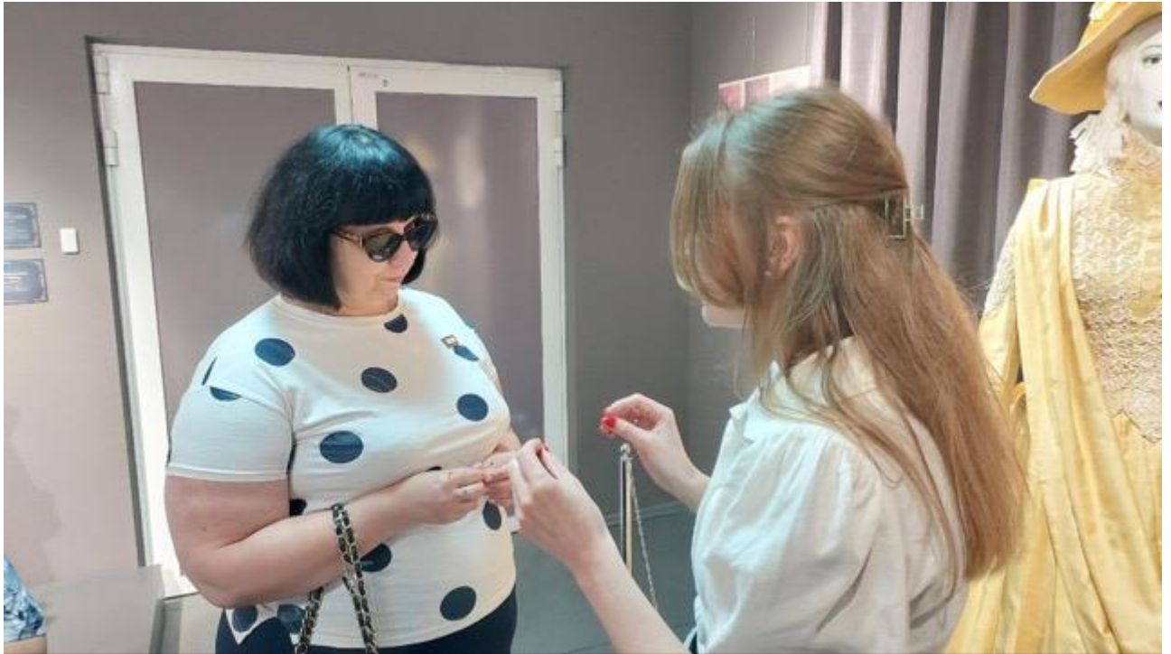
Рис. 1.1. Взаємодія з людиною з інвалідністю.

суспільства кожна людина з інвалідністю сприймається як певна невідповідність нормі. Для цієї групи основною проблемою є переміщення та використання так званих цивілізаційних зручностей, до яких відносяться туалети, ресторани, театри, кінотеатри, магазини, музеї та подібні місця.