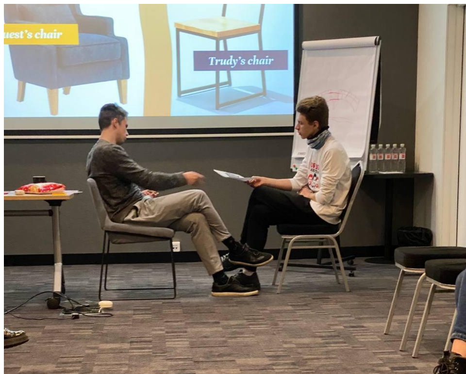
Рис. 2.1. Тренінг з інклюзивності для працівників Kyiv City Center Hotel.

обмеженими можливостями ввічливо та ефективно, надавати повну інформацію про доступні послуги та засоби, а також полегшувати доступ до послуг. Персонал повинен надавати людям з обмеженими можливостями доступну інформацію про засоби пересування, технічні пристрої та допоміжні технології, включно з новими технологіями та іншими формами допомоги, зокрема службами підтримки та зручностями, доступними в закладі. Персонал повинен бути навчений евакуювати людей з обмеженими можливостями в екстрених ситуаціях. Навчання з надзвичайних ситуацій слід проводити регулярно відповідно до законів і правил. Один з прикладів подібних тренінгів можна побачити на авторському рис. 2.1.