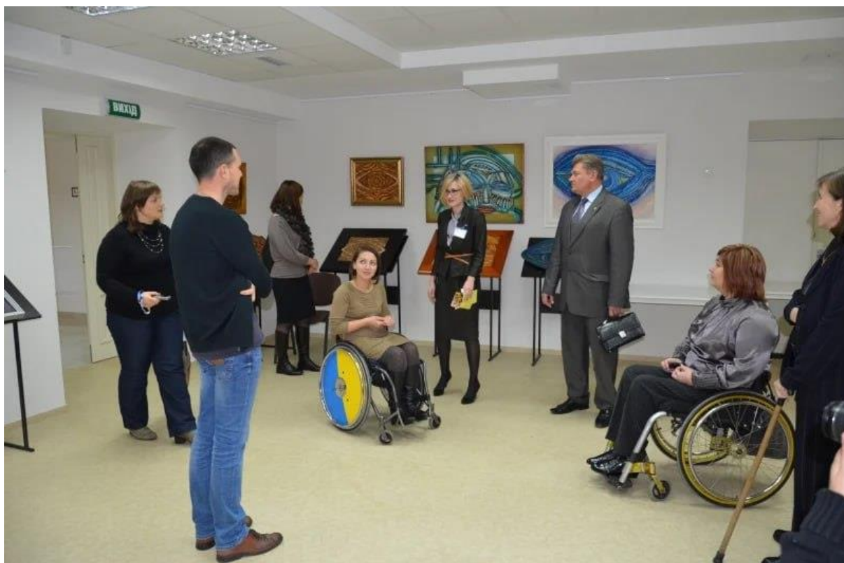
Рис. 3.1. Приклад комунікації з людьми з інвалідністю під час екскурсії.

Втім, передбачені формати для різних органів чуття, що робить експозицію доступною для більш широкої аудиторії. На жаль, експозиція не включає історії та твори осіб з інвалідністю.