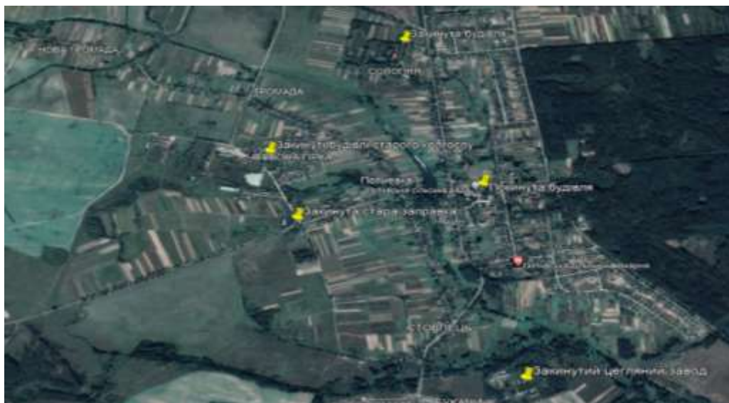
Рис.3.3 Занедбані будівлі в селі Потіївка [3]

З приводу відновлення будівель то їх можна відновити і використати для потреб села, у випадку з селом Потіївка адже були наявні дані щодо цього населеного пункту рис.3.3 .