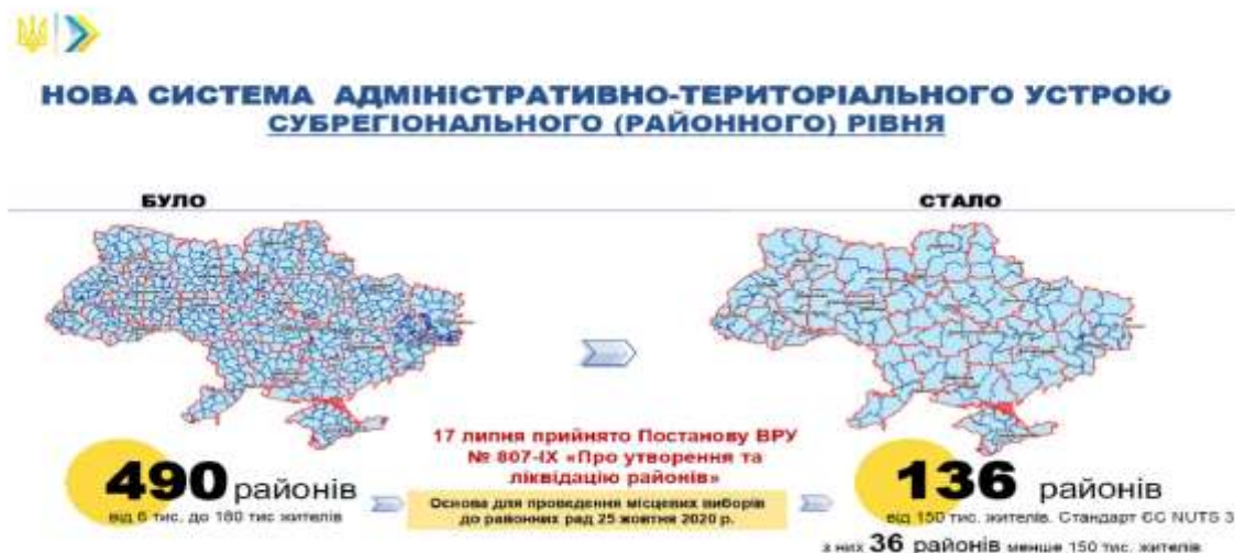
Рис. 1.2 Нова система адміністративно-територіального устрою субрегіонального (районного) рівня [30]

Нині основними ознаками сільських територіальних громад є спільна територія проживання, спільні інтереси місцевого просторового розвитку, соціальна взаємодія в процесі їх забезпечення, самоідентифікація кожного члена з громадою, бажання розвиватись.