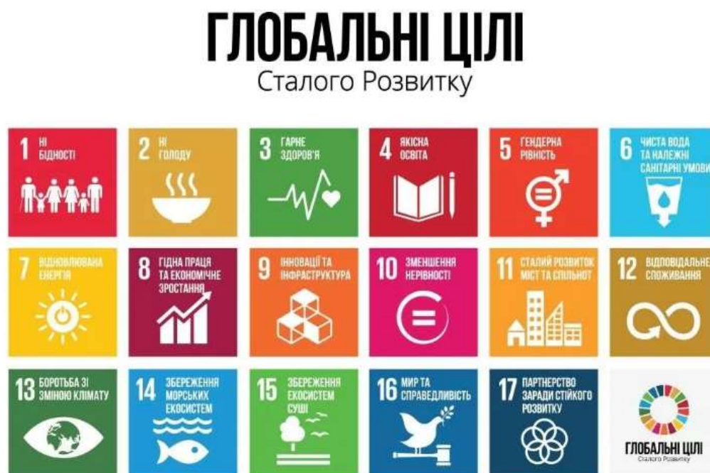
Рис.4.1 Глобальні цілі сталого розвитку [6]

територіальної громади. Всі пропозиції для робочої групи обґрунтовані на підставі глобальних цілей сталого розвитку рис 4.1 .