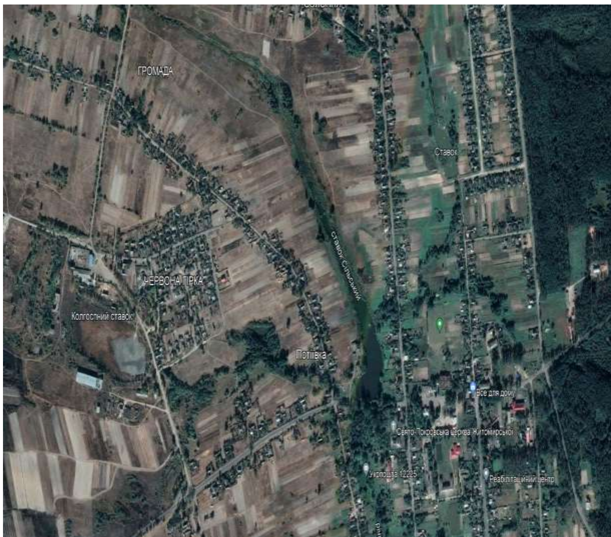
Рис.3.4 Село Потіївка на супутниковому зображенні [3]

На фрагменті супутникового зображення рис.3.4 бачимо, що території біля кожного ставка є вільними і придатними для облаштування відпочинкових зон.