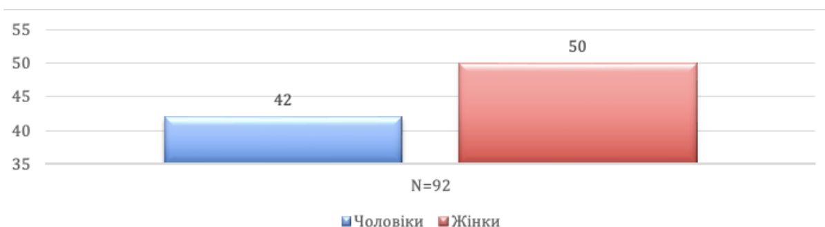
Рис. 2.3. Сімейний статус вибірки

Такий розподіл демонструє різноманітність у досвіді міжособистісних стосунків, що є суттєвим для вивчення сексуального сорому, адже інтимний досвід і партнерська взаємодія можуть впливати на його інтенсивність. Помітна частка осіб, які перебувають у стосунках, може свідчити про актуальність теми сексуальної сфери для цієї вибірки, оскільки саме в цей період формується більш стабільне ставлення до власної сексуальності.