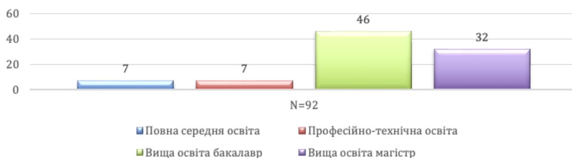
Рис. 2.2. Найвища отримана освіта серед вибірки

Половина респондентів мала вищу освіту рівня бакалавра, 34,8% здобули освіту магістра, тоді як лише 15,2% мали повну середню або професійно-технічну освіту.