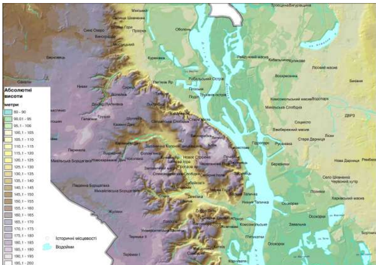
Рис. 1. Фізична поверхня м. Києва та історичні місцевості

Завдяки підвищеній правобережній частині міста, Київ завжди славився своїми мальовничими панорамами.