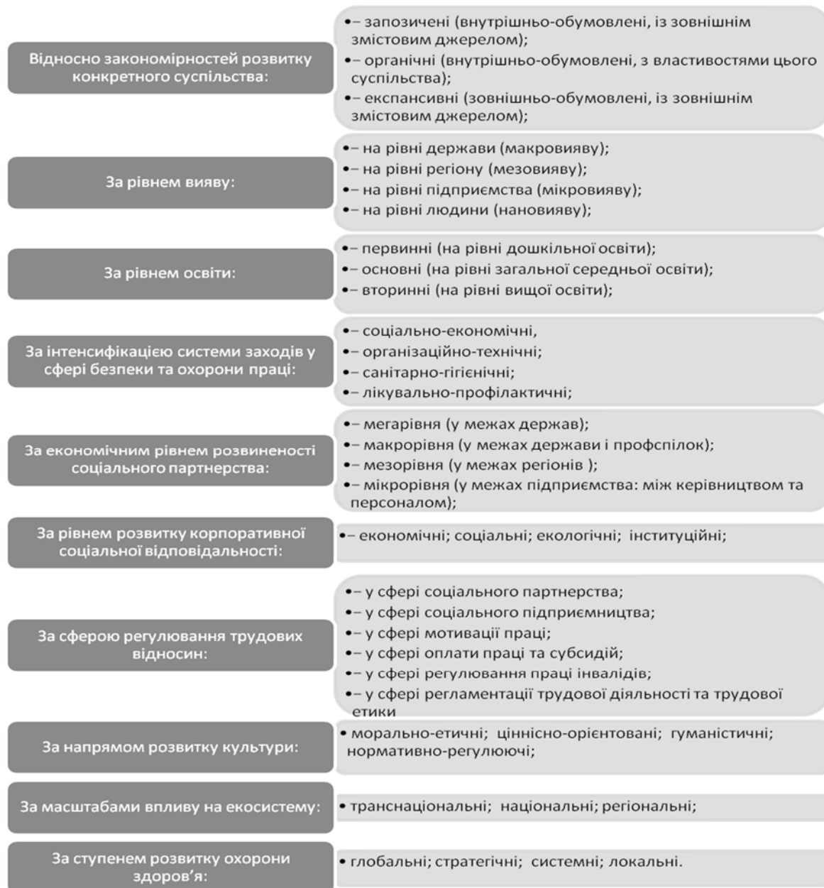
Рис. 1. Класифікація соціальних інновацій [16, с. 93]

А. Жалдак і Н. Симченко пропонують іншу класифікацію соціальних інновацій (рис. 1):