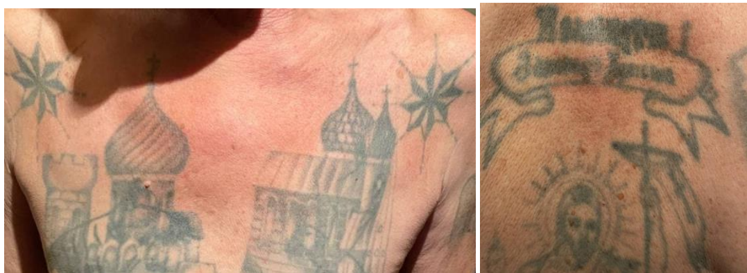
Рис.3.1. Візуалізація татуювань ув'язненого за тематикою малюнків