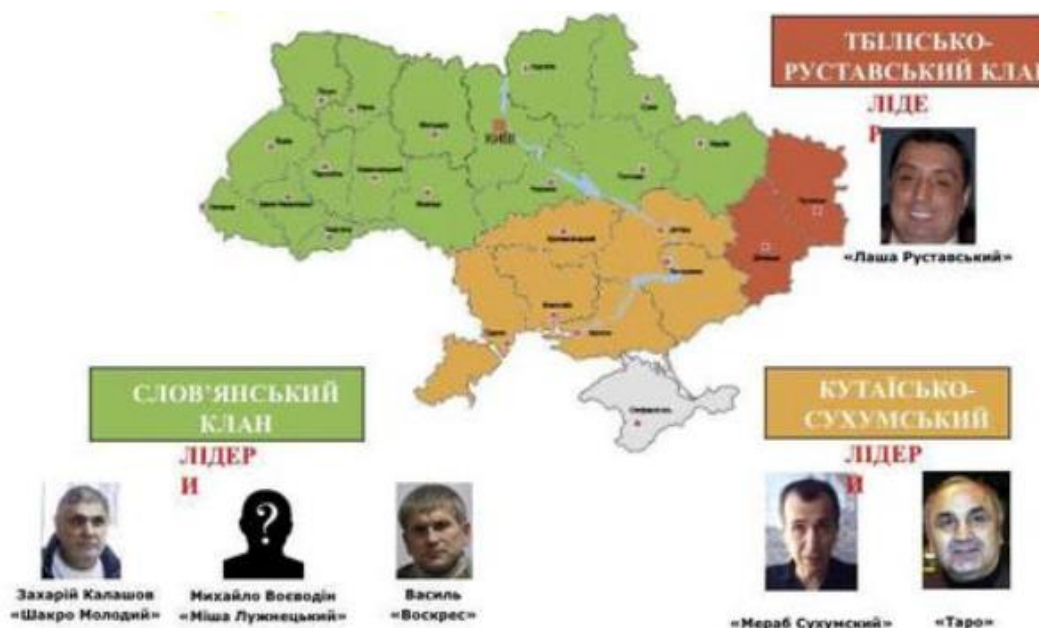
Рис.1.2. Злочинські клани, представлені в Україні

В Україні представлені 3 злочинські клани (рис.1.2).