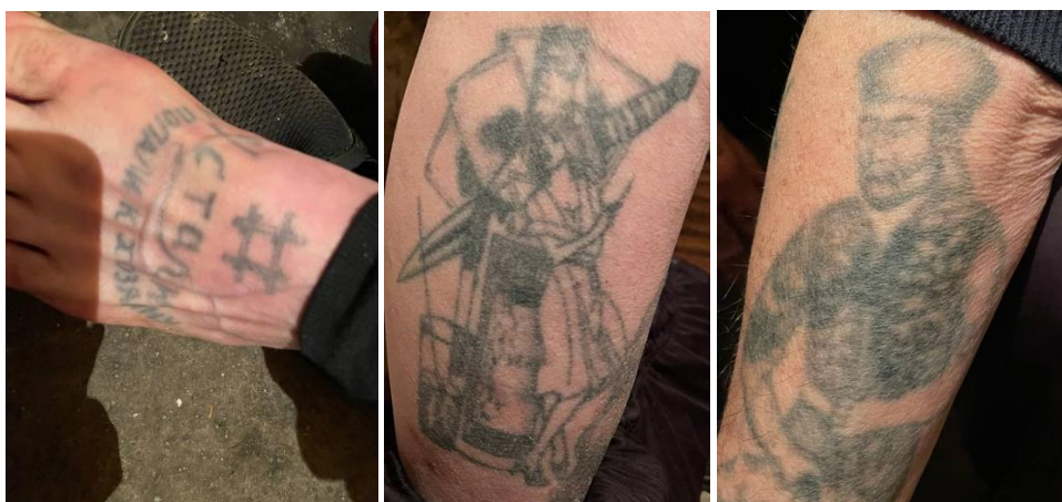
Рис.3.2. Візуалізація татуювань ув'язненого за розташуванням їх на тілі

Найбільш популярним місцем для нанесення татуювання є грудна клітка ув'язненого. На ній зображуються здебільшого собори, лики святих, оголені жінки, біблійні герої, черепи, тварини (найбільш популярні тигри та леви), чорти, зірки табірних лідерів тощо. Спина, як правило, використовується для татуювань і формі «церковних дзвонів, павуків, музичних інструментів, скелетів, гладіаторських поєдинків». Руки і ноги татуюються кинджалами, зміями, кайданами, якорями, кораблями, павуками тощо. На лобі позиціонують зображення свастики, павуків, абревіатур, коротких фраз, цифр (дати чи статті КДУ).