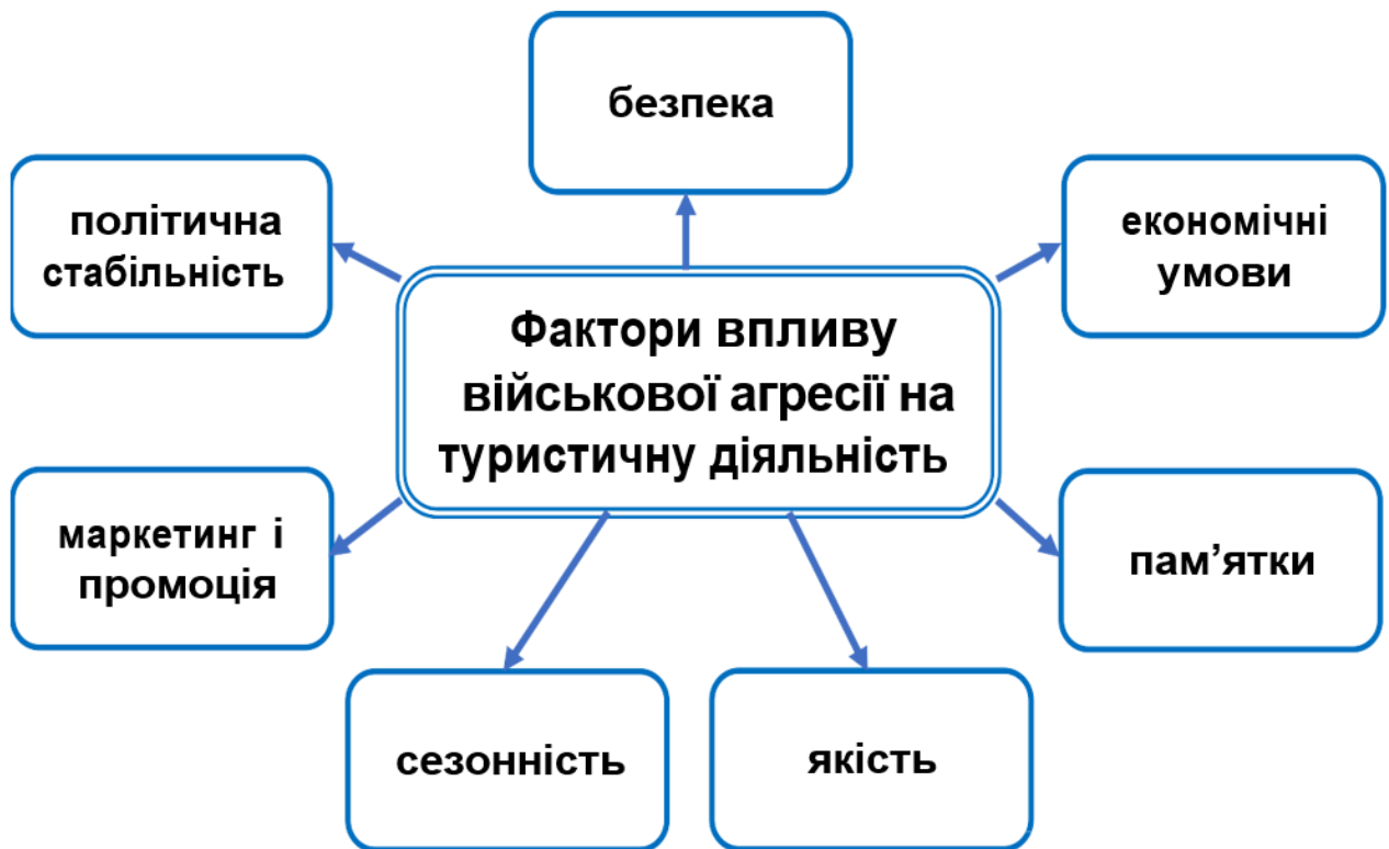
Рисунок 3.1. Ключові фактори впливу агресії військових на туристичну діяльність в регіонах України, які постраждали

Україна служить коридором для міграції птахів на трьох основних шляхах: Азово-Чорноморському (південному коридорі), Поліському (північному коридорі) та Дніпровському меридіанному міграційному шляху. це становить велике значення для водоплавних та прибережних птахів, таких як гуси, качки, гагари, кулики, мартини, крячки та інші.