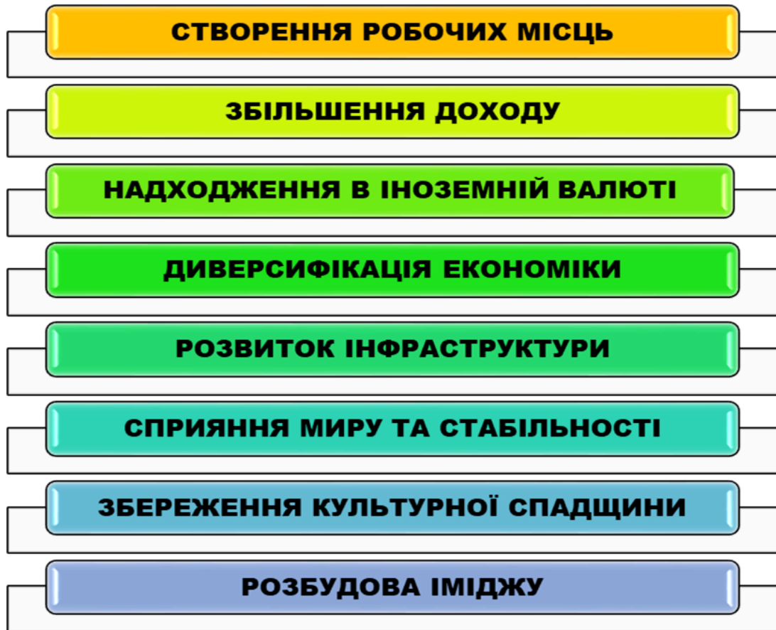
Рисунок 1.2 Впливи соціально-економічного чинника на розвиток туризму і економіки у регіонах України, які постраждали від війни

коштів. Статистичний аналіз використовується для виявлення відмінностей в туристичній активності між довоєнним, воєнним та післявоєнним періодами.