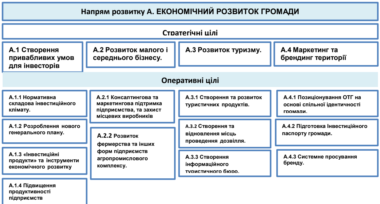
Рис. 1. Економічний розвиток громади