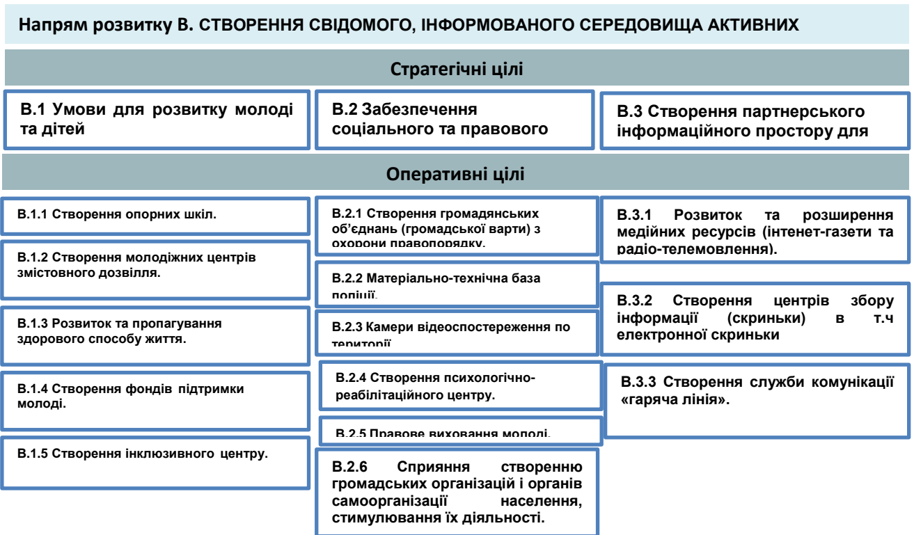
Рис.3. Створення свідомого, інформованого середовища активних громадян