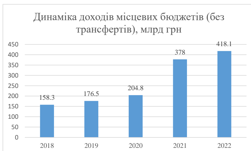
Рис 3.1 Доходи місцевих бюджетів, млрд грн

Реформу децентралізації було визнано як одну з найуспішніших в галузі публічного управління в Україні починаючи з 2014 року. Зміни до Бюджетного та Податкового кодексу України мали відчутний позитивний ефект на здійснення фінансової децентралізації: з 68,6 млрд грн у 2014 і до майже 177 млрд грн у 2019 році зросли обсяги місцевих бюджетів, а станом на 2022 рік їх обсяги становили 418 млрд грн [9]. Темпи консолідації місцевих органів влади були відзначені міжнародними експертними радами як дуже швидкі, адже до майже тисячі новостворених ОТГ увійшли близько 4,5 тис. сільських та селищних рад, яких у загальному на початок 2014 року було близько 12 тисяч. Таким чином, можна відзначити суттєву оптимізацію функціонування моделі публічної влади. Для внесення пропозицій і захисту інтересів суспільства було створено Інститут старост, очільники яких мали збирати інформацію щодо поточного стану справ у населених пунктах, а також отримувати звернення від громадян для якнайшвидшої їх передачі в роботу на виконання. Державна підтримка регіонального та місцевого розвитку за період 2014-2019 зросла у 41,5 разів: з 0,5 млрд грн до 20,5 млрд грн. За 5 останніх років доходи місцевих бюджетів за виключенням трансфертів зросли у 2,7 рази (див. Рисунок 3.1):