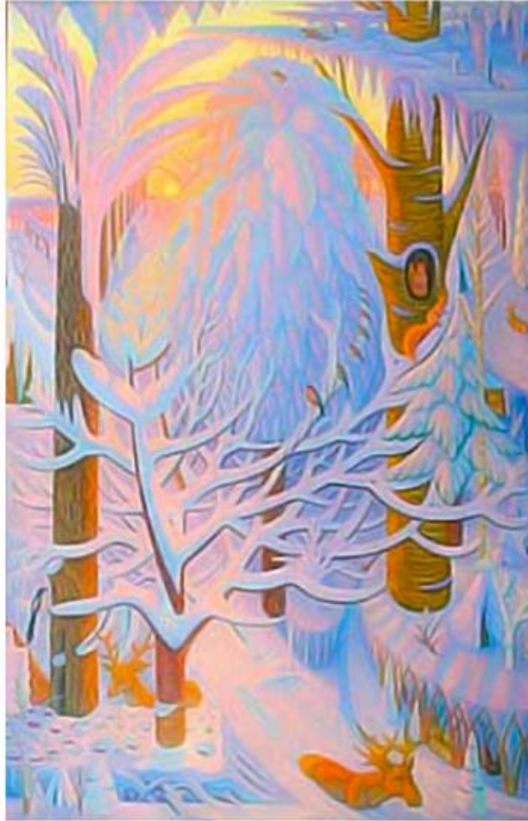
Є. Лещенко. Крізь снігову завісу

Українська мова: підручник для 8 класу / О.В.Заболотний, В.В. Заболотний. – К.: Генеза, 2016. – С. 88.