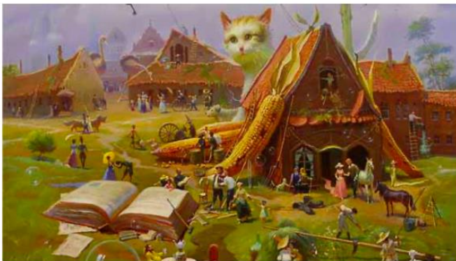
В. Рекуненко. Дитяче містечко

133 I. Розгляньте репродукцію картини В. Рекуненка, визначте її тему. Якими деталями та художніми прийомами розкрито цю тему?