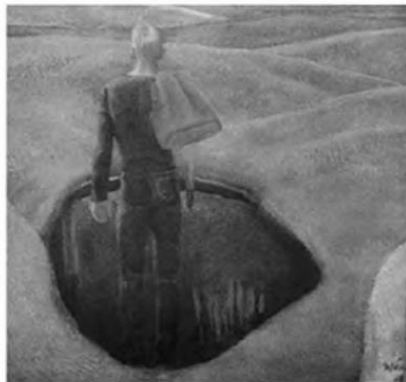
Т. Яблонська. Юність. 1969 р.

Кораблі! Шикуйтеся до походу! Мрійництво! Жаго моя! Живи! В океані рідного народу Відкривай духовні острови!