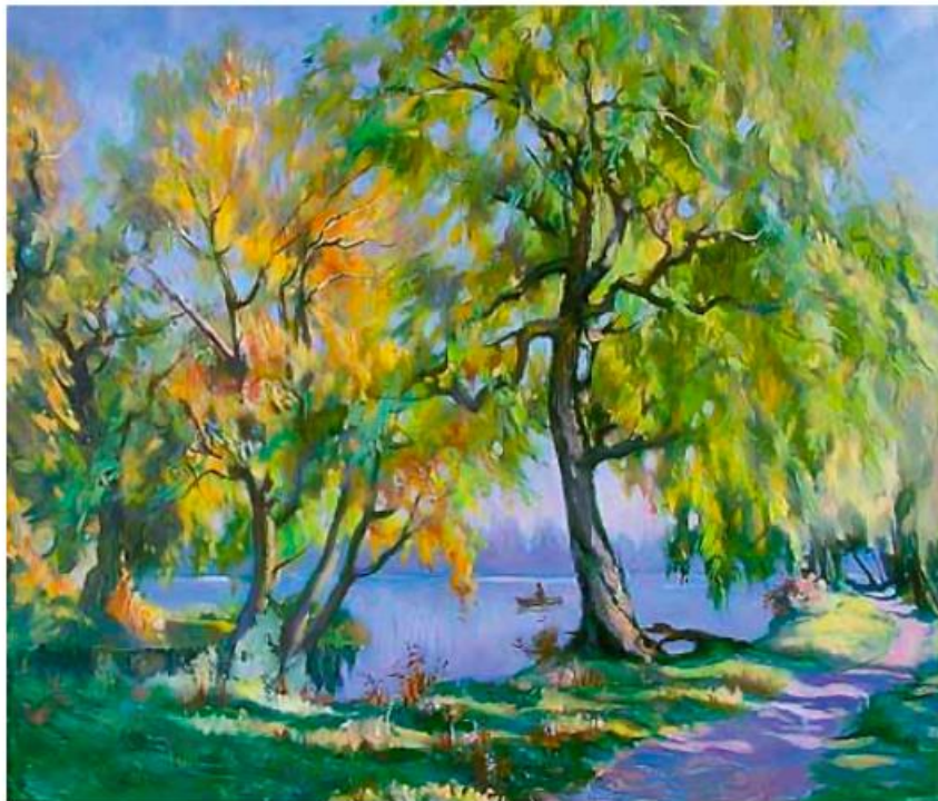
В. Кравченко. Стежка над Стугною

38 I. Розгляньте репродукцію картини. Що ви можете сказати про її композицію? Що зображено на передньому плані? Чи використовує художник контрастні кольори як засіб уявлення зображеного?