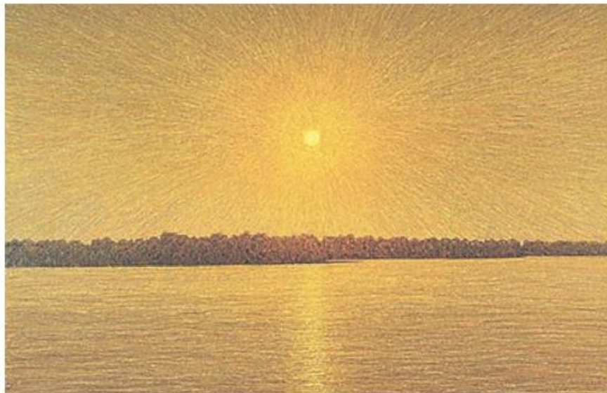
Іван Марчук. Сонце

– Для мене мистецтво – це життя і одкровення. Іншої альтернативи нема. І водночас мистецтво – це каторга. Я працюю 365 днів на рік і без цього не можу. Це присуд долі, карма, вирок, приреченість. І нікуди не дінешся. Я мрію погрітися на пляжі, полежати в траві, слухаючи, як вона росте, я хочу дивитися, як плывуть у небі хмари, хочу тішитися, веселитися, спілкуватися, не відмовився б піти до школи, щоб когось там чогось навчити ( З газети ).