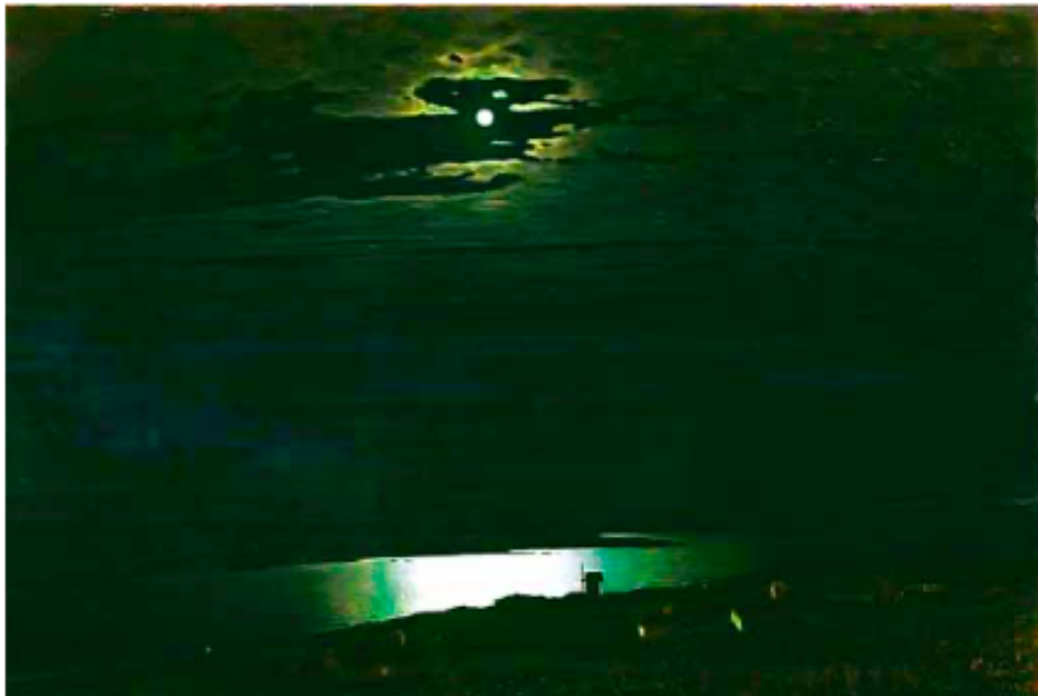
А. Куїнджі. Місячна ніч