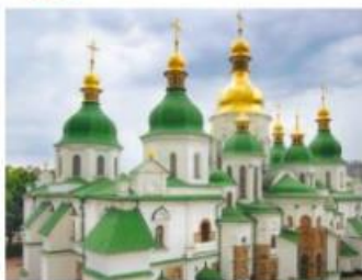
Софія Київська. м. Київ

1. Прочитайте тексти та виконайте завдання.