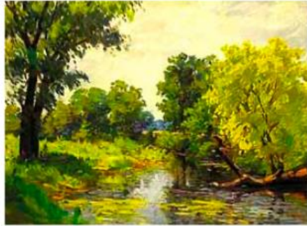
I. Кисіль. Лісова річка