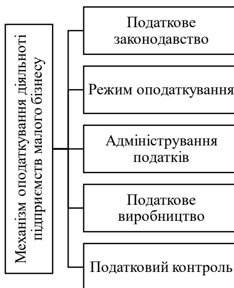
Рис. 3.1. Складові механізму оподаткування діяльності підприємств малого бізнесу

Нижче на рисунку наведено складові механізму оподаткування діяльності підприємств малого бізнесу.