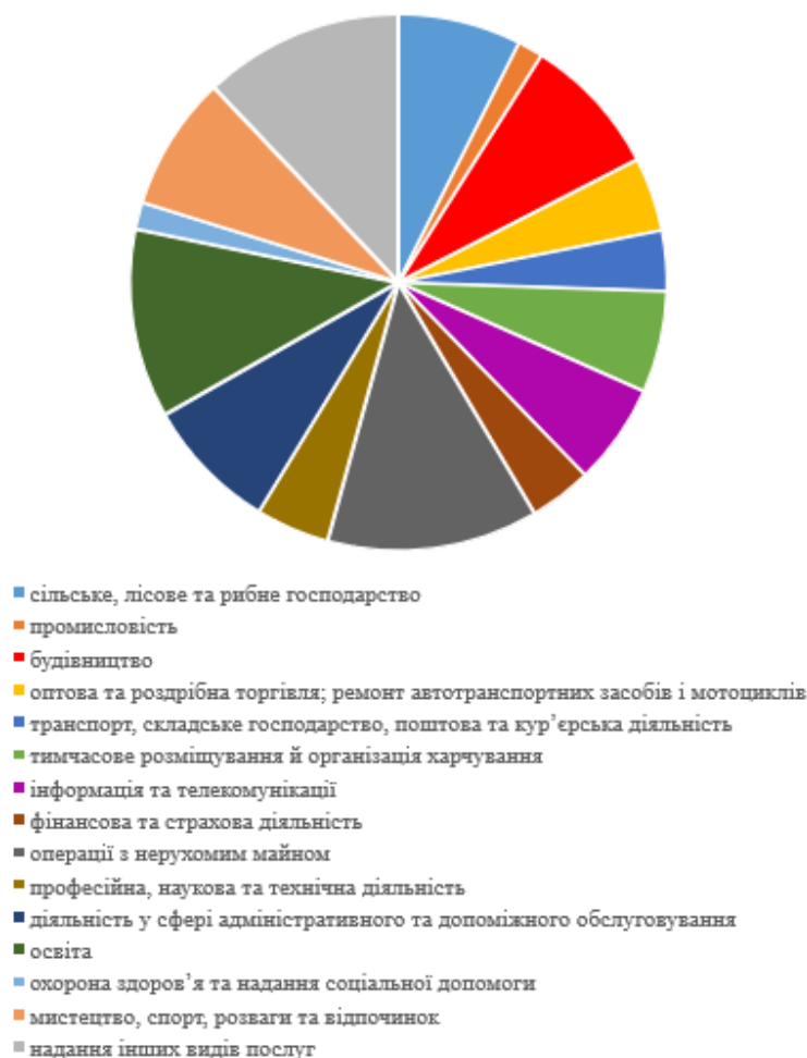
Рис. 1.1. Обсяг реалізованої продукції (товарів, послуг) малими підприємствами за різними видами економічної діяльності протягом 2020 року у відсотковому відношенні до загального обсягу реалізованої продукції