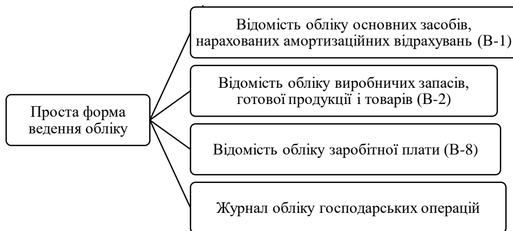
Рис. 2.1 Спрощена форма ведення бухгалтерського обліку

При використанні спрощеної форми бухгалтерського обліку малі підприємства ведуть Журнал обліку господарських операцій (далі – «Журнал»), в якому відображають залишки на бухгалтерських рахунках і реєструють у хронологічній послідовності всі господарські операції, здійснені на підприємстві (рис. 2.1).