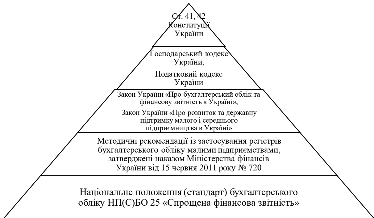
Рис. 1.3 Рівні нормативно-правового регулювання діяльності підприємств малого бізнесу

норми, які гарантують право на приватну власність та підприємницьку діяльність. Ці принципи лягли в основу Господарського кодексу, постанов Верховної Ради України та указів Президента України, які становлять другий рівень нормативно-правової бази. На третьому рівні розташовані постанови Кабінету Міністрів України, а на четвертому рівні - нормативні акти міністерств та відомств, такі як інструкції, положення, накази тощо. Нижче проілюстровано багаторівневість нормативно-правового регулювання діяльності підприємств малого бізнесу в Україні (рис.1.3).