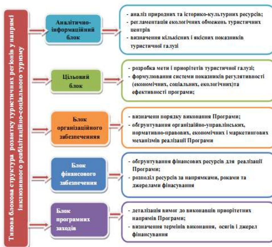
Рис.3. Типова структура розробки та реалізації регіональних цільових програм у галузі інклюзивного туризму

Важливим напрямом розвитку туристичних регіонів України є розробка та реалізація регіональних цільових програм у галузі інклюзивного туризму, яку можна представити у вигляді типової структури (Рис.3).