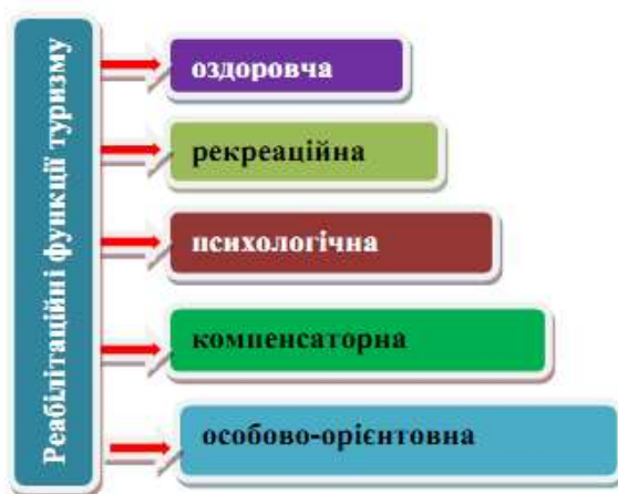
Рис.2. Основні реабілітаційні функції туризму

Інклюзивний реабілітаційно-соціальний туризм, як вид реабілітації, може реально допомогти відновити фізичні та психоемоційні сили, покращити психологічне самопочуття, допомогти не фіксуватися на своїх соматичних відчуттях, і, залучаючись до ритму «нормального» існування, повного життєвого розпорядку, вийти з важкої стресової ситуації, пов'язаної із захворюванням і наслідками лікування, відчуті себе активним членом суспільства, потрібним людям, відчуті жагу до життя [3].