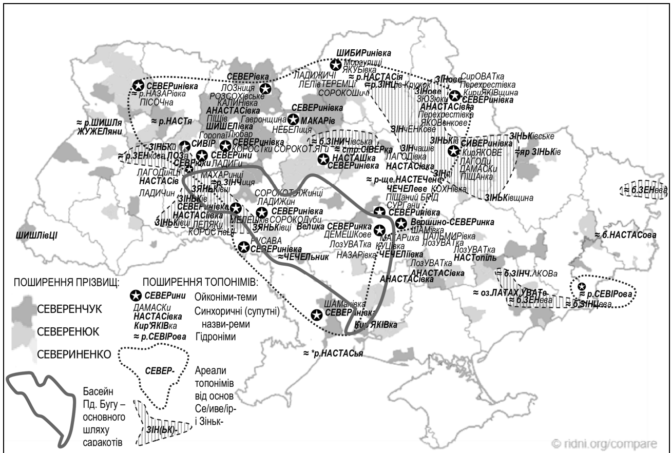
Рис. 6. Слід основи Север-/ Сєвїр- в Україні (прототип Σεβήρος Αντιοχείας). Основа картосхеми – розподіл прізвищ 503 Северенчук, 181 Северенюк, 351 Севериненко [©ridni.org/compare]. Показано макрокореляцію топооснов Се/иве/ір- і супутніх (синхоричних) – Настас-, Зіньк-, Ладиг-, Дамаск- та ін. [©К.Тусченко]. Ці аргументи ономастики відповідають відомостям хронік про участь племен Наддніпрянщини у подіях історії Візантії початку VI ст.

Це з такої кількості селищ люди плавали до Лаодікії, бували в Дамаску, знали про Зенону, Анастасія, Севера, Якова, Пешітту, мелекитів, поділяли або відкидали певні догмати христології. Висновок: від Волині до Дінця у V–VI ст. існував соціум, який жило духовне життя Візантії