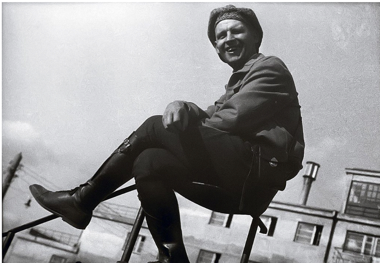
1930 рік. Олександр Родченко на перилах