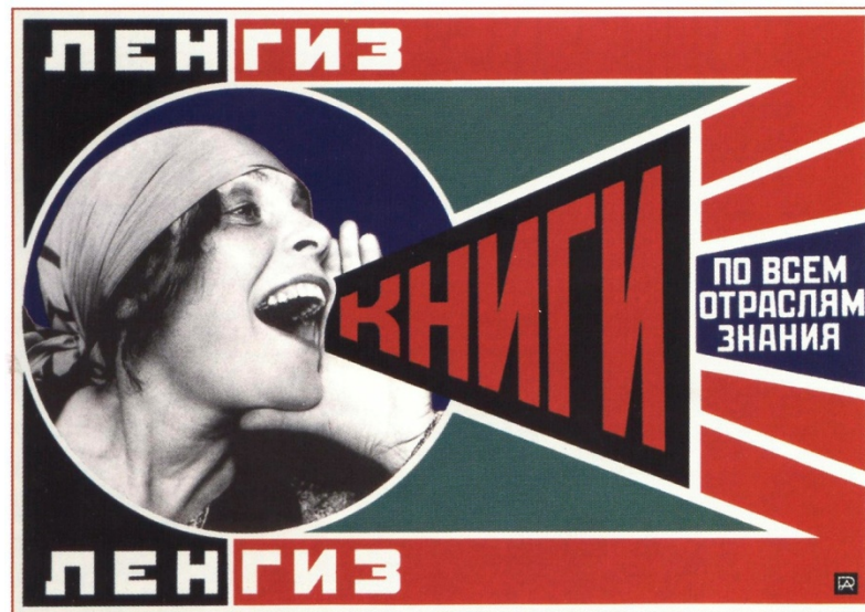
Олександр Родченко. «Книги по всіх галузях знання». Плакат 1925 року. Ленгиз

відповідала завданням нового часу і була затребувана всюди - від художніх творів до торгівлі і політичної агітації.