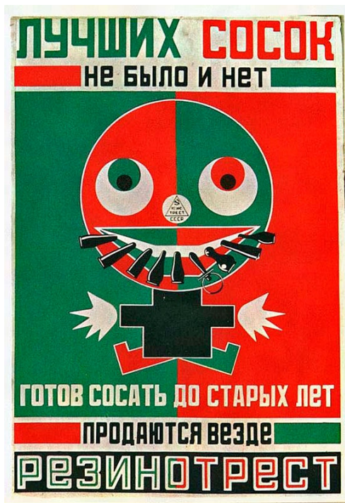
«Кращих сосок не було і немає ...» 1923 рік. рік