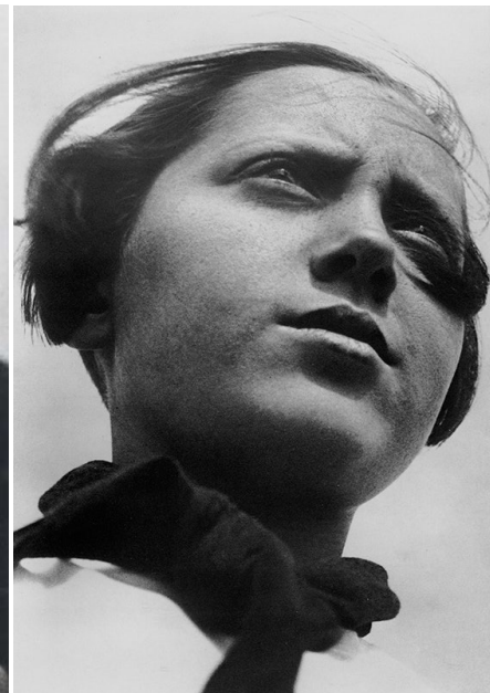
«Піонерка». 1930 рік.