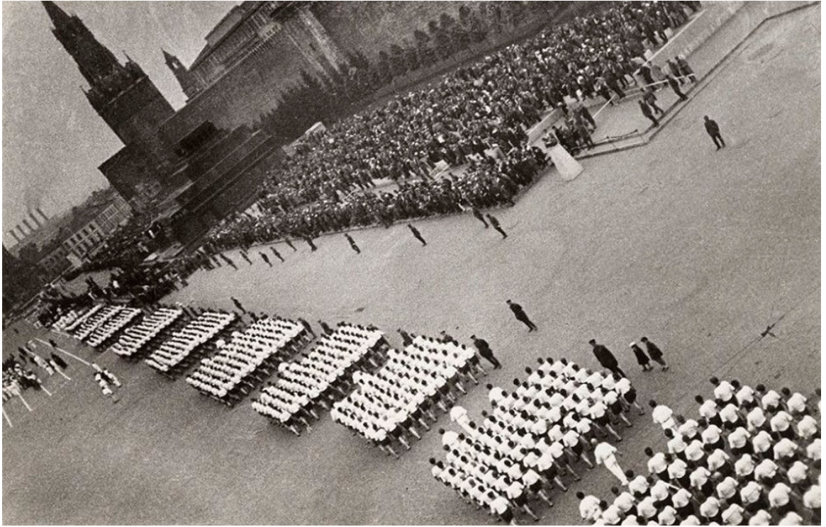
Олександр Родченко. «Парад на Червоній площі»