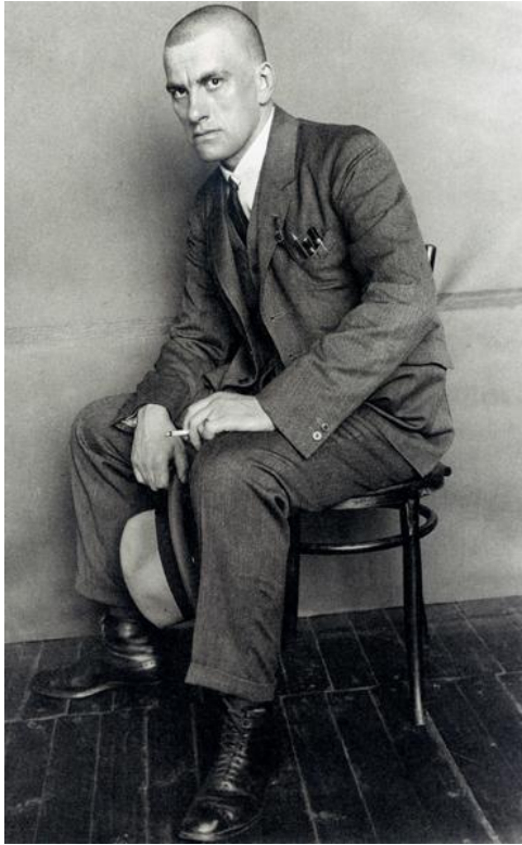
Володимир Володимирович Маяковський, 1920 рік