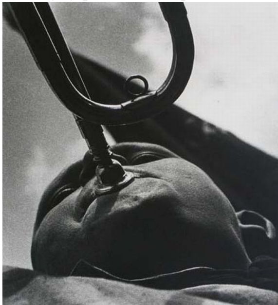
«Піонер-трубач». 1930 рік.

Іноді підхід Родченко опинявся занадто прогресивним для свого часу, деякі його роботи піддавалися шквалу критики. Так, відомий знімок «Піонер-трубач» був визнаний неполіткоректним - на думку критиків, хлопчик на фото вийшов схожим на «вгодованого буржуа», що не відповідало духу радянської пропаганди.