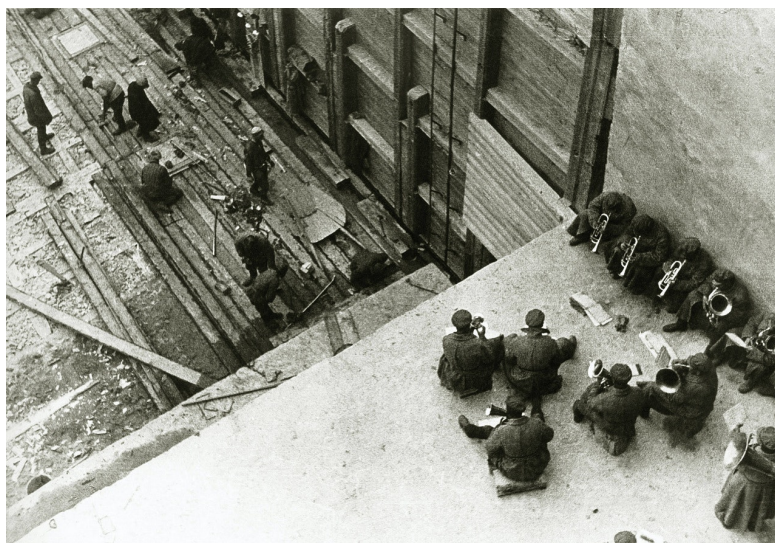
Будівництво Біломорканалу. 1933 рік

Родченко звинуватили у формалізмі. Він сприйняв це дуже важко: «Как же так, я всей душой за советскую власть, я всеми силами работаю с верой и любовью к ней, и вдруг мы неправы». І влада дає Родченко шанс довести свою відданість, доручивши йому в 1933 році сфотографувати відкриття Біломорсько-Балтійського каналу і оформити номер «СРСР на будівництві».