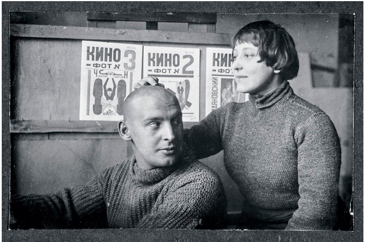
Олександр Родченко з дружиною Варварою Степановою, 1920 рік

приверженцем». Незабаром Родченко переїжджає в Москву з наміром приєднатися до футуристів.