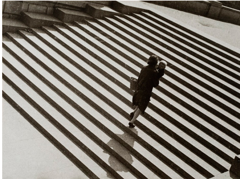
«Драбина». 1930 рік

Другим відкриттям Родченко стала діагональ в фотографії. Він використовував лінію як основний конструктивний елемент спочатку в живописі, а потім в фотографії. За допомогою діагоналі Родченко приносить динаміку і відмовляється від врівноваженою статичною композиції.