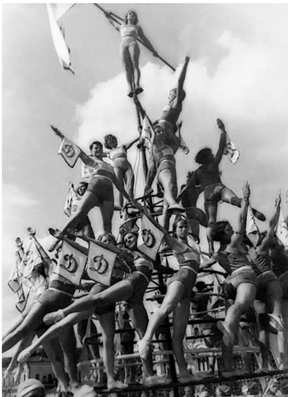
«Жіноча піраміда». Спортивний парад на Червоній площі. 1936 рік.