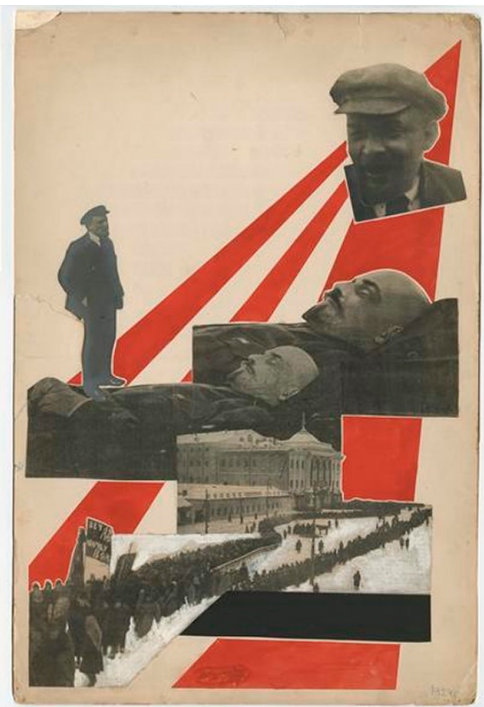
«Похорон Володимира Леніна». 1924

Власна камера з'являється у Родченко в 1924 році, коли йому було 33 роки і його художні погляди вже були сформовані ідеями конструктивізму. Він використовує нові прийоми в фотографії, не боючись експериментувати. Його відкриття ракурсів, особливо «зверху вниз» і «знизу вгору»,