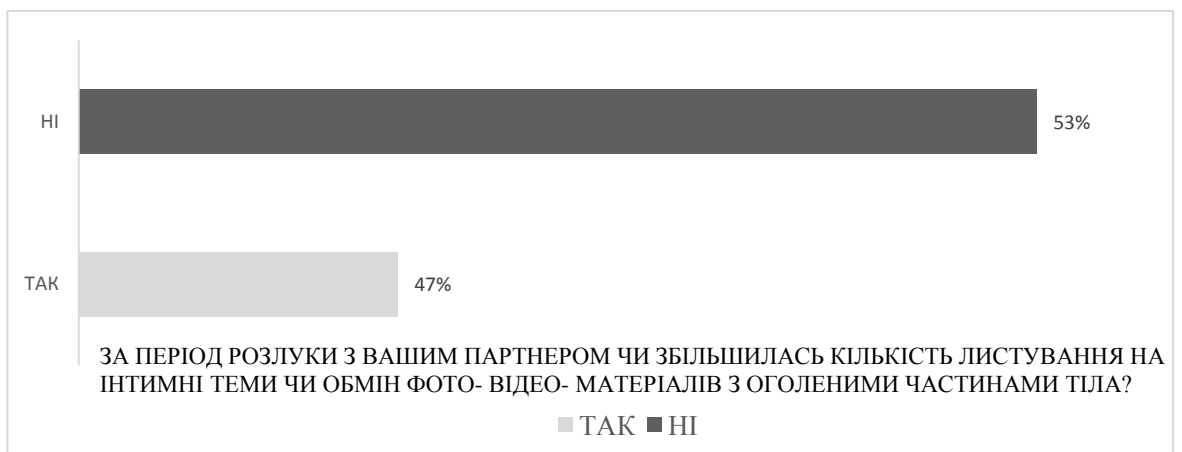
Рис.6 Залежність поширення секстингу на партнерів, які вимушено не перебували разом.

Щодо огляду досліджень наших іноземних колег, встановлено, що секстинг – зустрічається серед підлітків і дорослих людей. За даними різних досліджень, його поширеність варіюється від 2 до 20% (іноді до 50%). Однак існують певні вікові та культурні відмінності (дослідження Б'янки Клеттке 2016 року). По-перше, інтенсивність секстингу зростає від підліткового віку (11-19 років) до ранньої дорослості (20-35 років), а потім йде на спад (дослідження М.П. Баумгартнера 2014 року). По-друге, представники одних культур (наприклад, афроамериканці) беруть участь в секстинг частіше, ніж представники інших (наприклад, євроамериканці). Крім цього, існують дані про статеві відмінності: одні дослідження говорять про те, що чоловіки частіше беруть участь в секстинг, ніж жінки; інші – про те, що жінки роблять