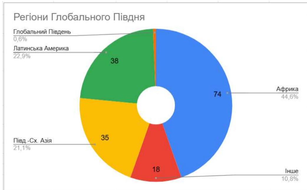
Рис. 2. Регіональна структура

Структура бази джерел, розподілена за типом публікацій, демонструє переважання коротких наукових публікацій, які складають понад дві третини від усієї вибірки. Це свідчить про зацікавленість наукової спільноти в окремих аспектах проблематики, а також про стійкий інтерес в представників різних наукових напрямів до проблеми африканістики. З іншого боку, недостатня кількість фундаментальних досліджень ускладнює систематизацію наявного знання й стримує розвиток узагальнюючих підходів до аналізу взаємодії України з Глобальним Півднем, особливо в сучасній геополітичній ситуації, що сформувалась після 2022 р. Винятком у цьому контексті є напрям Південно-Східної Азії, у вивченні якого, на відміну від інших регіонів, простежується більш сформована структура досліджень. Це створює передумови для більш системного осмислення регіону й контрастує з фрагментарністю досліджень, що властиво африканському та латиноамериканському напрямам.