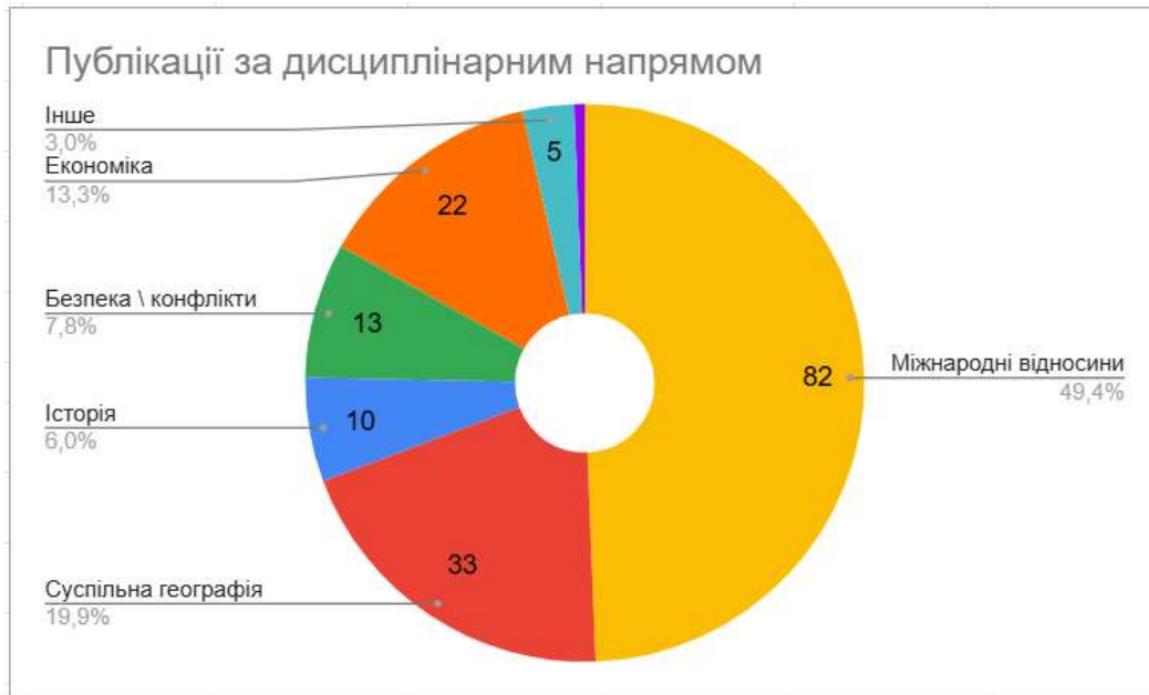
Рис. 3. Публікації за дисциплінарним напрямом

показовим з огляду на потенційну важливість ресурсного виміру Африканського континенту. Важливо враховувати не лише самі поклади корисних копалин, а й умови доступу до них, які визначаються політичними й регіональними особливостями. Це формує запит на окремий вимір досліджень у площині політичної географії, що має значний прикладний потенціал.