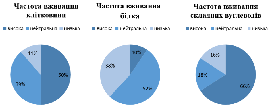
Рис. 1. Частота споживання основних груп продуктів у раціоні підлітків 14–17 років (n = 44)

Аналіз харчових звичок показав, що 50 % підлітків часто вживають продукти, багаті на клітковину (овочі, фрукти, супи з овочевим компонентом). Часте споживання білкових продуктів тваринного та рослинного походження зазначили лише 10 % респондентів, тоді як складні вуглеводи (крупни) регулярно присутні у раціоні 66 % підлітків (рис. 1). Частоту вживання "нездорової їжі" (фастфуд, солодощі) як нейтральну оцінили 61 % респондентів, високу – 16 %, низьку – 23 %.